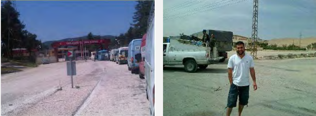
Droite : Un des activistes du convoi en Syrie, photographié devant un véhicule militaire syrien qui a accompagné le convoi tout au long de son séjour en Syrie. Gauche : Le convoi quitte la Turquie et entre en Syrie (Site Internet Kiaoragaza.net, 11 mai 2012)

8. Le 11 mai, le convoi a atteint la Jordanie. Après des négociations avec les autorités jordaniennes, 22 activistes ont reçu l'autorisation de dormir à Amman. De Jordanie, le convoi a fait route vers le port d'Aqaba où il a attendu les autorisations égyptiennes (Al-Dustour 13 mai 2012). En parallèle à l'itinéraire du convoi, George Galloway s'est rendu au Liban où il a rencontré Nabih Berri, le Président du Parlement et les anciens Présidents Emile Lahoud et Salim el-Hoss. Galloway a déclaré que la question des Palestiniens était prioritaire sur les autres dossiers arabes et a appelé le peuple syrien à permettre le passage du convoi sur sa route pour Gaza (Al-Safir, 9 mai 2012).