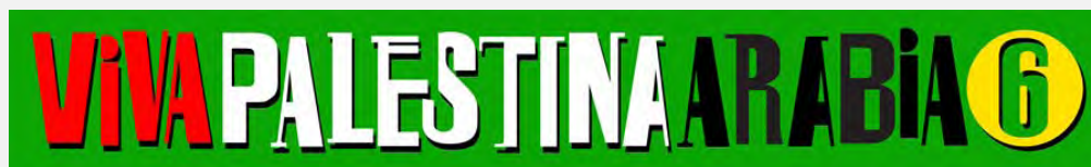
Logo du dernier convoi organisé par Viva Palestina