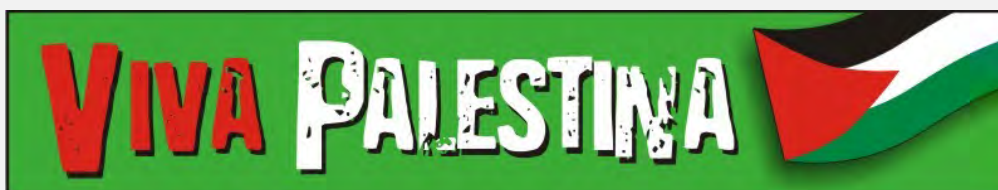
Logo de l'organisation