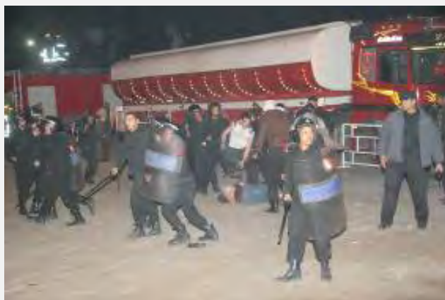
Les forces égyptiennes opposées aux activistes de Lifeline 3 à El Arish suite au refus des autorités égyptiennes de permettre l'entrée d'une partie des camions par le terminal de Rafah (ihh.org.tr, Janvier 2010)

égyptiens. Près de 50 activistes et soldats ont été blessés dans l'incident. 5 A posteriori, cette confrontation est une anticipation des heurts violents initiés par les activistes de l'IHH turque à bord du Mavi Marmara.