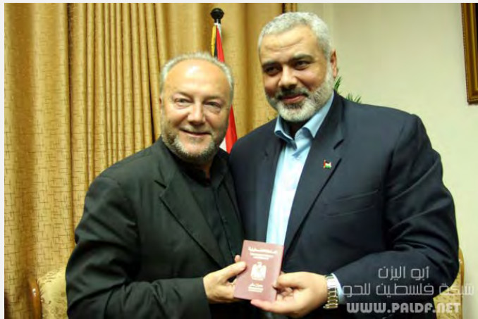
Ismail Haniya remet un passeport palestinien à George Galloway (Paldf, 11 mars 2009)