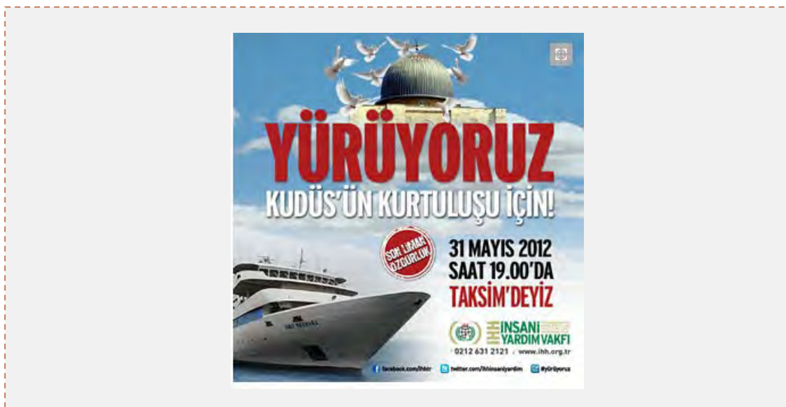
Объявление о мероприятиях, посвященных годовщине событий на "Мави Мармара" (сайт ИНН, 28 мая 2012 года)