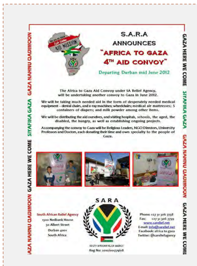
Бланк регистрации для участия в колонне (сайт организации, 29 мая 2012 г.)