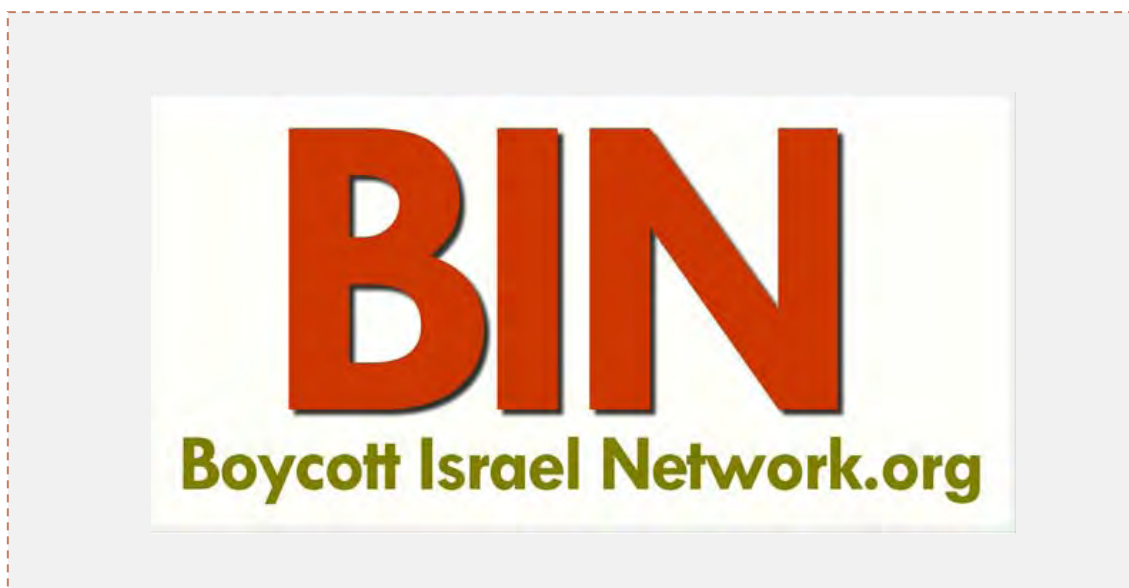
Логотип организации, устроившей демонстрацию во время представления театра "Габима"