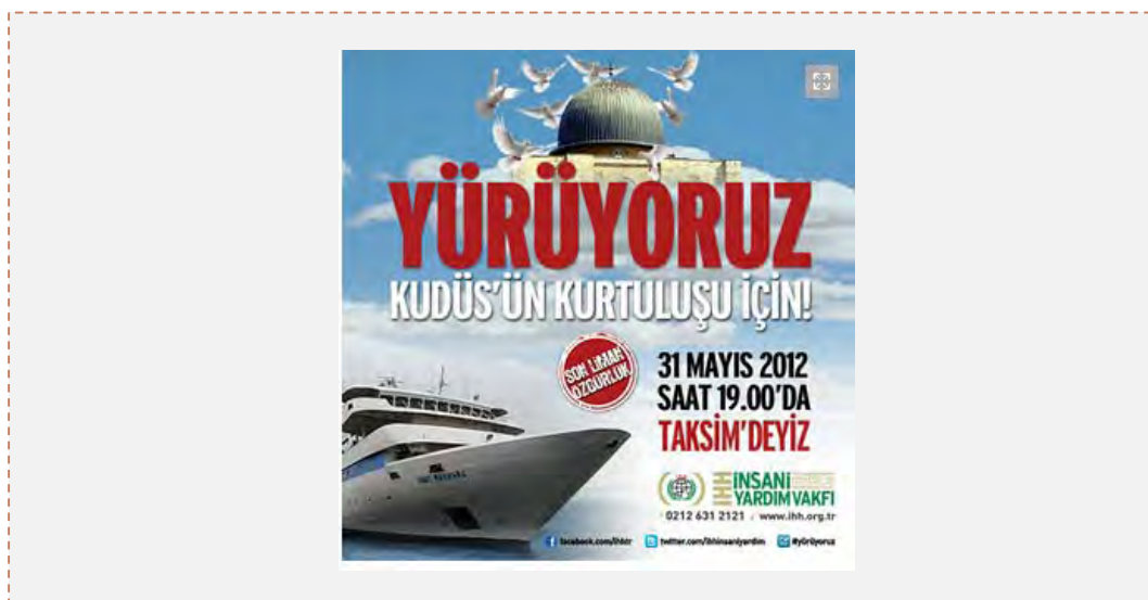
اطلاعیه مربوط به مراسم دومین سالگرد رویداد «ماوی مرمره» (سامانه IHH، بیست و هشتم مه 2012)

■ در این میان، اعلام شد که دادستان بندر استانبول ترکیه سرانجام علیه چهار تن از فرماندهان نظامی پیشین ارتش اسرائیل که در رویدادهای کشتی «ماوی مرمره» در بهار سال 2010 شرکت داشته اند، کیفرخواست صادر کرده است. افرادی که علیه آنها کیفرخواست صادر شد، از جمله عبارتند از: رییس پیشین ستاد کل ارتش ارتشید گابی اشکنازی، فرمانده پیشین نیروی دریایی ژنرال الیغزر مروم، رییس رکن اطلاعات ارتش پیشین عاموس یدلین و رییس یگان تکاوران دریایی، آویشای لوی کیفرخواست شامل 144 صفحه است که در آنها چهار اتهام مطرح گردیده از جمله قتل 9 تن سرنشینان کشتی «ماوی مرمره»، آسیب رسانی و شکنجه فعالان طرفدار فلسطینی ها از سوی قصد قبلی. دادستانی ترکیه خواهان حبس ابد و زندان های اضافی برای متهمان شده است. در کیفرخواست به نادرستی ادعا گردیده است که سرنشینان کشتی تنها چاقوی پلاستیکی، قاشق و چنگال در اختیار داشته اند 5 (خبرگزاری «آناتولی»، بیست و سوم مه 2012).