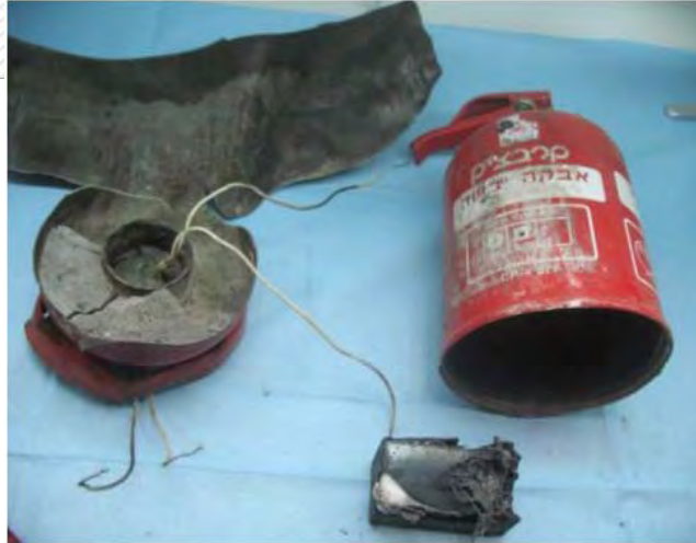
כוחות הביטחון עצרו חוליה שהפעילה ב-19 באפריל מטענים מתוחכמים, נגד כלי רכב ישראלי סמוך לכפר יאטא (דרום הר חברון). בתמונה אחד המטענים