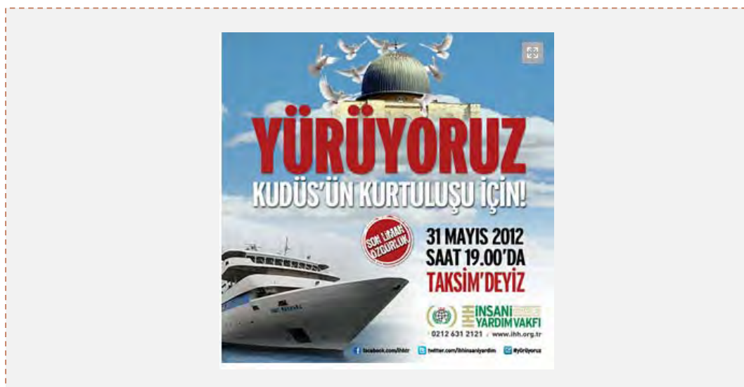
הודעה על אירועי יום השנה ל"מאוי מרמרה" (אתר IHH, 28 במאי 2012)