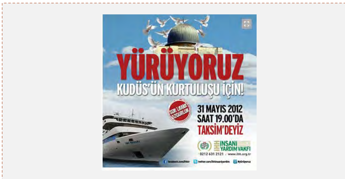
Annnonce des événements-anniversaire du Mavi Marmara