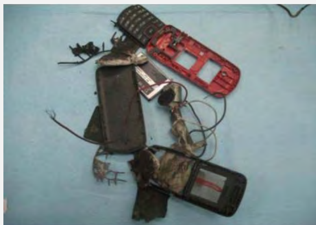
Restes des téléphones portables par lesquels les engins piégés ont été activés près de Yattah

■ Le 19 avril dernier, des engins piégés ont été activés contre un véhicule israélien près de Yattah (Sud d'Har Hébron). Dans cette attaque, plusieurs engins ont été utilisés en parallèle et devaient être activés par des téléphones portables. Il n'y a eu ni blessé ni dégât dans l'attaque. Suite à l'enquête de l'événement, deux jeunes Palestiniens résidents du village de Yattah qui avaient fabriqué les engins ont été arrêtés. Les deux ont avoué avoir fabriqué de nombreux engins et également avoir fait exploser un engin en 2007. Par ailleurs, ils ont reconnu avoir été impliqués dans plusieurs incidents de tirs de pierres.