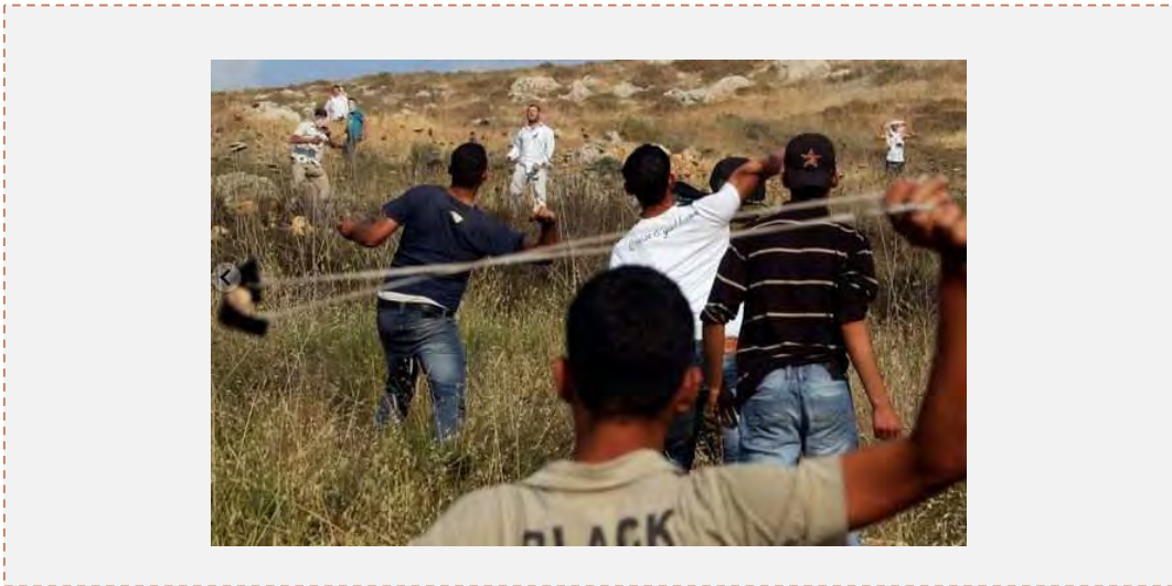
Инцидент с применением силы между поселенцами и палестинцами

палестинцев резиновыми пулями. В результате столкновения несколько палестинцев были ранены (Ynet, 21 мая 2012 г.)