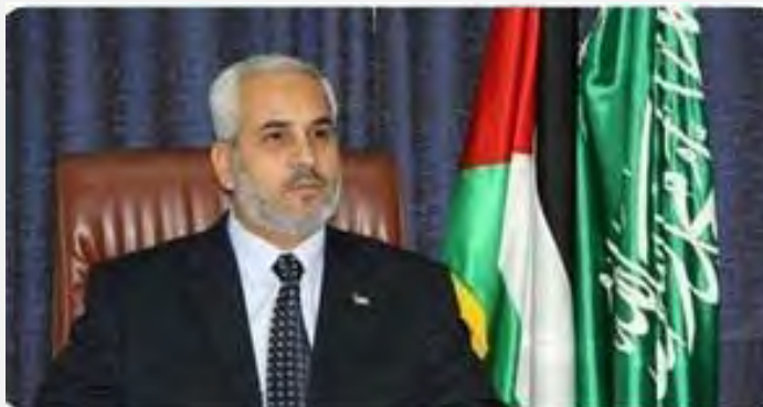
Фузи Бархум на пресс-конференции, состоявшейся после встречи в Каире (Palestine-info, 20 мая 2012 г.)