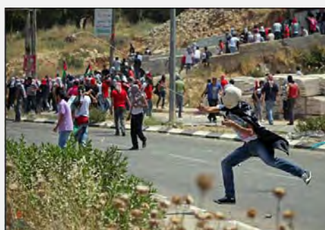
Столкновения и нарушения порядка в День "накба" в Рамалле (агентство ВАФА, 15 мая 2012 г.)