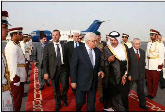
Абу Мазен в момент прибытия в Доху (19 мая 2012 года)