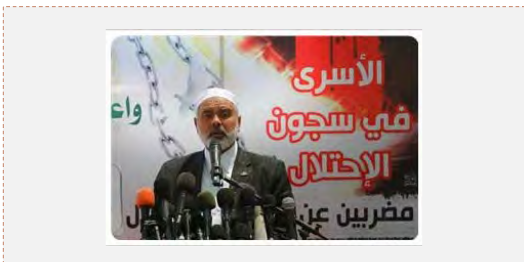
Исмаил Хания приветствует участников колонн (17 мая 2012 года)