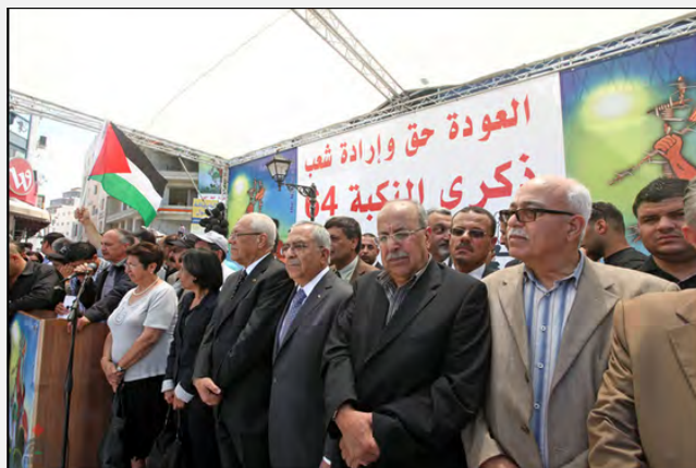
Руководство палестинской администрации на церемонии Дня "накба" в Рамалле. На плакате за их головами написано: "Возвращение – это право и желание народа" (агентство ВАФА, 15 мая 2012 года)