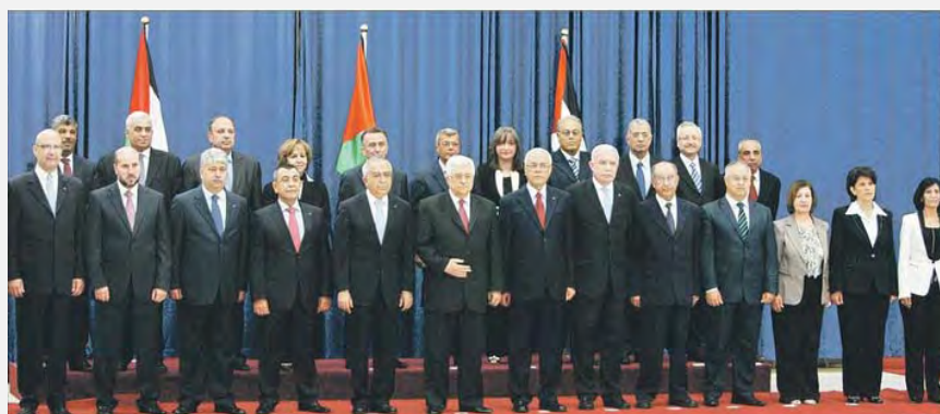
Новое палестинское правительство (газета Аль Халидж, 17 мая 2012 г.)