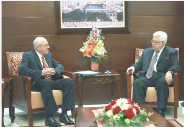
Абу Мазен во время встречи с представителем главы правительства Израиля адвокатом Ицхаком Молхо (агентство ВАФА, 13 мая 2012 г.)