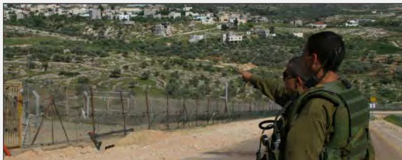
Военнослужащие Армии обороны Израиля несут охрану у забора безопасности в Иудее и Самарии (пресс-служба Армии обороны Израиля, 15 мая 2012 года)

(расположенную к югу от Рамаллы), которая в последнее время превратилась в один из центров демонстраций с применением насилия (пресс-служба Армии Обороны Израиля, 15 мая 2012 г.)