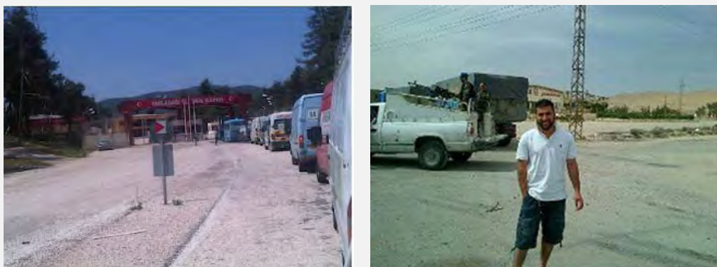
Справа: активист колонны в Сирии на фоне армейского автомобиля, сопровождавшего колонну во время ее пребывания в этой стране. Слева: Переход колонны из Турции в Сирию (11 мая 2012 г., http://kiaoragaza.net/ )