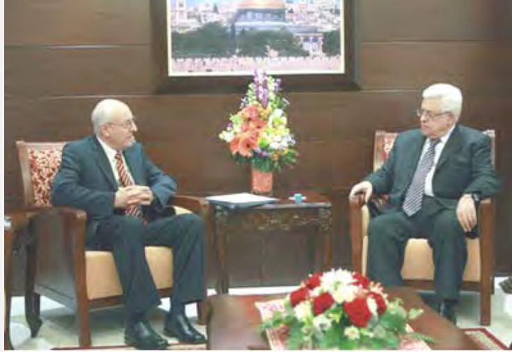
أبو مازن يلتقي المحامي يتسحاق مولخو، مندوب رئيس الوزراء الإسرائيلي (13 أيار/مايو 2012)