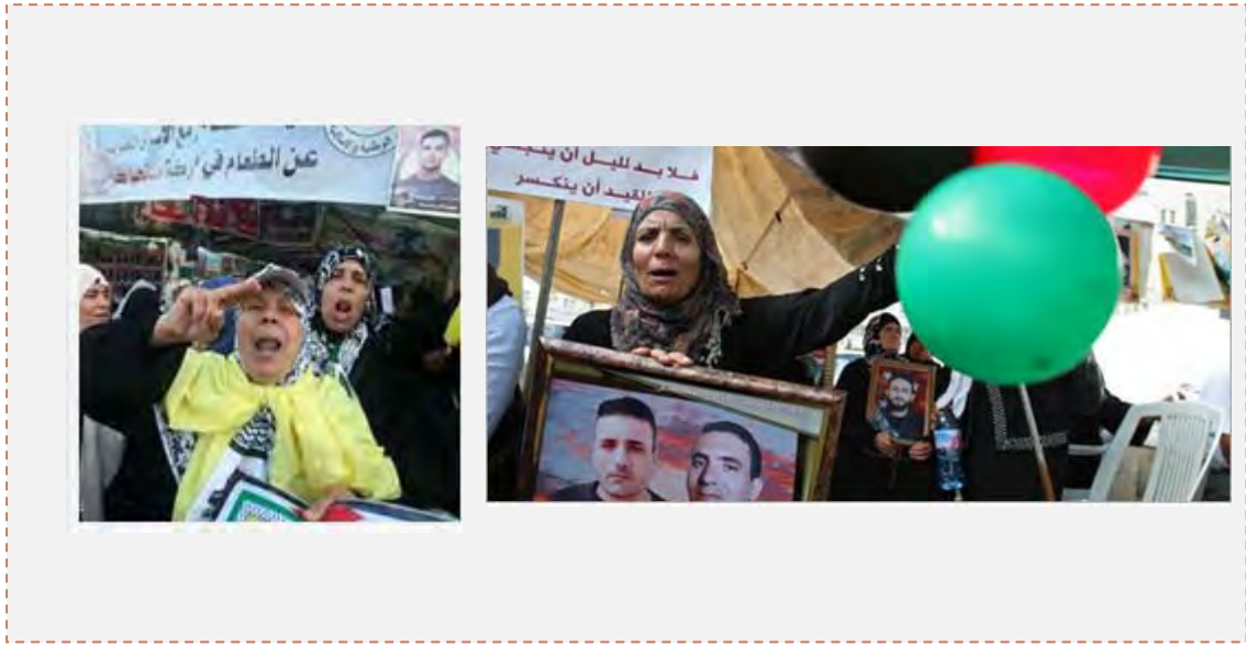
تعبير الفرحة في قطاع غزة عند الاعلان عن وقف السجناء اضرابهم عن الطعام