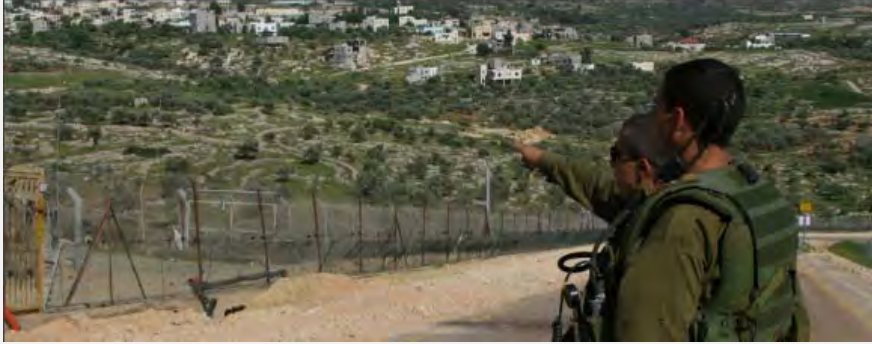
جنود جيش الدفاع خلال عمليات حراسة بالقرب من السياج الأمني الفاصل في الضفة الغربية (الناطق بلسان جيش الدفاع، 15 أيار/مايو 2012)