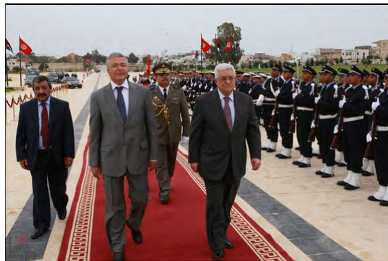
ابو مازن از تونس دیدار کرد («وفا»، بیست و نهم آوریل 2012)

دیدگاه فلسطینی ها پیرامون از سرگیری گفت و گو با اسرائیل و احتمال مراجعه فلسطینی ها به سازمان ملل و درخواست آنها برای شناسایی بین المللی کشور فلسطین و موضوع آشتی داخلی فلسطینی ها رایزنی نمود («الایام»، بیست و نهم آوریل 2012). قرار است پس از تونس، ابو مازن رهسپار لیبی شود.