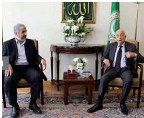
خالد مشعل با نبیل العربی، دبیرکل اتحادیه عرب در مصر دیدار کرد (فلسطین - اینفو http://www.palestine-info.co.uk ، بیست و نهم آوریل 2012)

■ همزمان، از نوار غزه نیز هیئتی شامل اعضای شورای فانگزاری حماس با ریاست احمد بحر از راه گذرگاه الرفح برای شرکت در گفت و گوهای انجام شده بین خالد مشعل و منابع امنیتی مصر، عازم قاهره شد و قرار است پس از مصر نیز رهسپار دیدار از بحرین گردد («معان»، بیست و هشتم آوریل 2012).