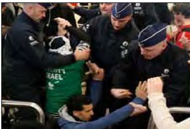
פעילים אנטי-ישראלים מוחים בשדה התעופה שרל דה גול שבפריס לאחר שעלייתם לטיסה לישראל נמנעה