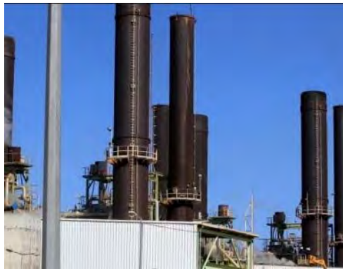
תחנת הכח של עזה: החלה לקבל סולר לתעשייה

שיפור באספקת החשמל לרצועה וחלה התאוששות בהיקף תנועת כלי הרכב. מנגד, מתמהמהת הגעת ספינת הדלק מקטר, שאמורה הייתה לתרום להקלה במשבר 2 .