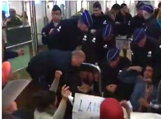
פעילים מתפרעים ומתנגדים למעצר בבריסל (youtube.com)

■ בנמל התעופה בן גוריון התקיימו כמה הפרות סדר מצומצמות, שהנוכחות הביטחונית הישראלית המאסיבית מנעה התפתחותם לאירוע פרובוקטיבי חריג . עיקר המחאות התקיימו ע"י פעילים, שעלייתם למטוס נמנעה, בנמלי אירופה השונים . בלטה הפגנה בנמל התעופה שרל דה גול שבפריס בה נטלו חלק עשרות פעילים, שקראו להחרים את ישראל והשמיעו קריאות גנאי נגד החברות שסירבו להטיסם. כמה מהם התעמתו עם אנשי ביטחון מקומיים ומספר פעילים נעצרו. מחאות (בהיקף מצומצם) התקיימו בנמלי התעופה של בריסל, ג'נבה ורומא . באחד המקרים התפרע אזרח פורטוגלי במהלך הטיסה של נתיבי האוויר הירדניים והוא נעצר עם ירידתו מהמטוס.