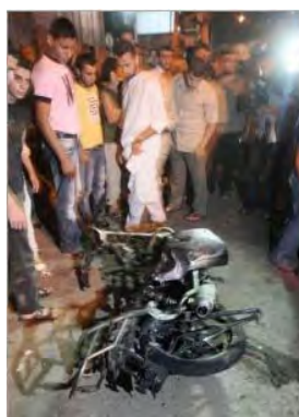
La motocicleta de la unidad terrorista, tras el ataque de la Fuerza Aérea (qudsmedia.com, 7 de abril de 2012)