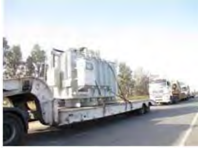
Transporte de los transformadores desde Israel a la central eléctrica de la Franja de Gaza (sitio del Coordinador de actividades en los territorios, 9 de abril de 2012)