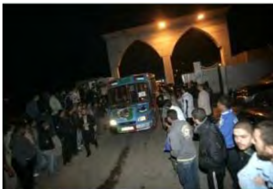
"Miles of Smiles" número 11 entra en la Franja de Gaza por el paso de Rafah (qudsmedia.com, 5 de abril de 2012)