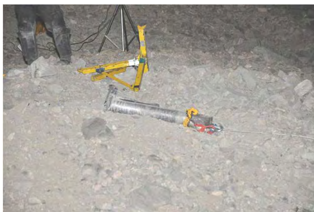
Cohete de artillería Grad 122 mm, uno de los tres lanzados contra Eilat desde la península del Sinaí (Policía de Israel, 5 de abril de 2012)