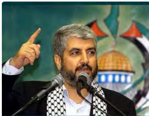
Jaled Meshal pronuncia un discurso en un acto relacionado con Jerusalén (qudsmedia.com, 7 de abril de 2012)

■ En un discurso pronunciado en un acto relacionado con Jerusalén que se celebró en Doha, el jefe de la sección política de Hamás Jaled Meshal declaró que el suelo de Jerusalén está "bañado en la sangre de los mártires (shahids)". Según él la aspiración es que Jerusalén sea la capital del Estado palestino y de la nación islámica. Destacó además que el único camino correcto para la liberación y restitución de Jerusalén pasa por "la resistencia y el fusil" (Al-Jazeera, 6 de abril de 2012).