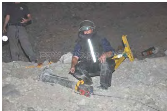
Uno de los cohetes hallados en Eilat (Policía de Israel, 5 de abril de 2012)

■ Ninguna organización se atribuyó el lanzamiento. Hamás negó estar implicada, y en un comunicado oficial asegura que no hay indicios de disparo de cohetes desde el Sinaí y que las alegaciones de Israel son una "especie de embuste sionista" (sitio de la Oficina de propaganda del gobierno de Hamás, 5 de abril de 2012). Ismail Haniya, jefe del gobierno de Hamás, dijo que su administración sigue de cerca los acontecimientos y recalcó ante todas las organizaciones palestinas la necesidad de actuar "solamente dentro de las fronteras palestinas" (Al-Qods, 6 de abril de 2012).