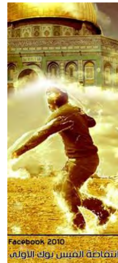
Poster de la campagne "Facebook 2010 – Première intifada sur Facebook" 5

7. Selon la première annonce du groupe "première intifada sur Facebook," datée du 25 février 2010, l'objectif est d'aider à protéger la Mosquée Al-Aqsa et les lieux saints de l'Islam. L'annonce appelle les membres du groupe à rejoindre la lutte pour les lieux saints à Jérusalem et à faire pression sur leurs gouvernements afin de les inciter à adopter une position agressive à l'encontre d'Israël. L'annonce appelle toute la population musulmane à travers le monde à faire du vendredi 26 février, une "journée du martyr en Palestine." Le texte affirme également que des organisations juives ont l'intention de déclarer une journée internationale pour le troisième temple, pendant laquelle elles prévoient de faire irruption sur le Mont du Temple et d'y établir une synagogue. L'annonce se termine par les mots : "Faites savoir au monde que les Juifs commettent des crimes nazis contre les Palestiniens et qu'ils boiront de la même tasse [la même dont ils obligent les Palestiniens à boire]." Signé, ceux qui languissent le martyr." 4 Voir l'Annexe pour la version complète de l'annonce en arabe.