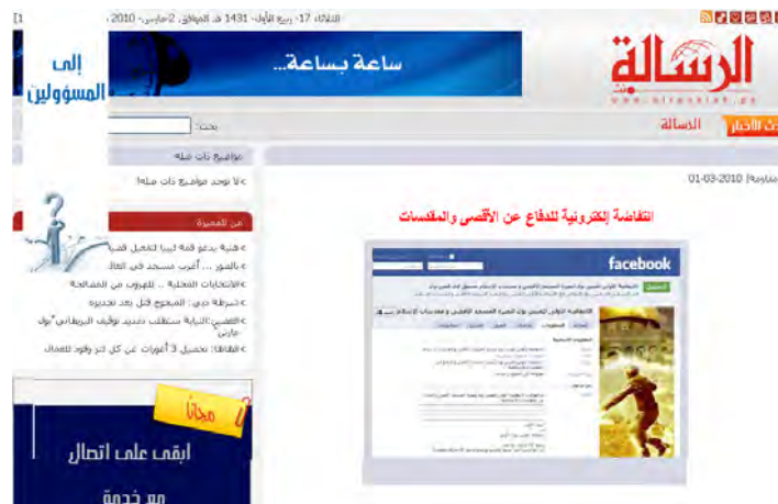
L'article publié dans le magazine du Hamas Al-Resala (28 février 2010)

physiques musulmanes, dont les membres du groupe appellent à une campagne nommée "première intifada sur Facebook," afin de sauver la Mosquée Al-Aqsa ainsi que les lieux saints de l'Islam, et à un "réveil électronique." Ils ont également lancé un appel à lancer une campagne de propagande visant à souligner l'importance des lieux saints pour l'Islam et les Musulmans. Les membres du groupe ont indiqué qu'ils n'étaient pas moins actifs que les Palestiniens faisant face à "la brutale occupation sioniste en Judée-Samarie et dans la bande de Gaza." 1 (www.sharkiaonline.com, 28 février 2010). L'article a également été publié sur Al-Resala, un site Internet affilié au Hamas, le 28 février 2010 et dans d'autres médias du Hamas.