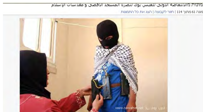
Messages de soutien au terrorisme sur le groupe Facebook : une mère attache une ceinture explosive à son fils, qui porte un masque

11. Pour les Palestiniens, l'utilisation d'Internet permet une connexion directe entre la bande de Gaza, contrôlée par le Hamas, et la Judée-Samarie, contrôlée par l'AP. Elle permet aussi aux Palestiniens de maintenir des contacts avec des pays du Moyen-Orient et d'ailleurs, où des éléments islamiques et terroristes radicaux existent. En plus des implications de propagande, il s'agit aussi d'une plate-forme commode pour l'encouragement à la haine d'Israël . L'auditoire-cible de tels réseaux est généralement les jeunes qui peuvent être sous l'influence de ces messages . Cela peut permettre aux éléments islamiques et terroristes radicaux d'inciter les jeunes à troubler l'ordre public en Judée-Samarie, notamment sur le Mont du Temple .