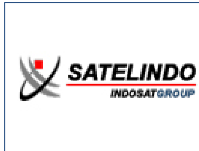
Le logo du groupe SATELINDO qui exploite le satellite PALAPA-C2