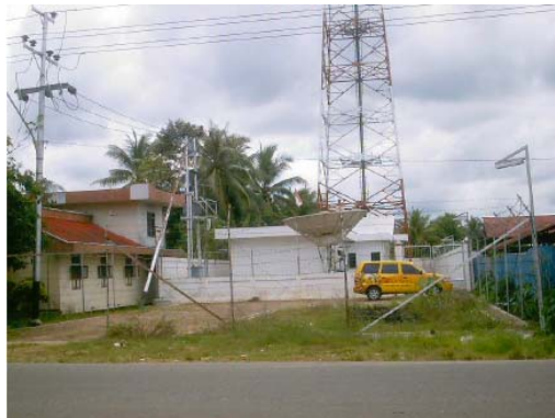
Base terrestre du satellite de la compagnie SATELINDO