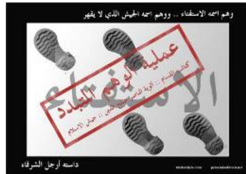
L'attaque est appelée “fin de l'illusion [israélienne],” poster publié sur le site Internet du Hamas aussitôt après l'attaque.