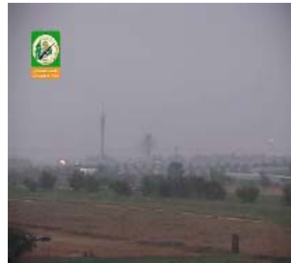
A gauche: les forces de Tsahal durant l'attaque (Télévision Al-Jazeera, 25 juin); à droite: le site de l'attaque vu du côté palestinien (Site Internet du Jihad Islamique Palestinien, 25 juin).