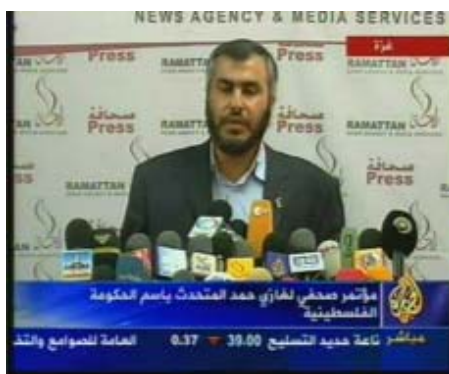
Le Dr. Ghazi Hamad s'adresse aux Israéliens en hébreu (Télévision Al-Jazeera, 25 juin).

* Le porte-parole du gouvernement du Hamas, le Dr. Ghazi Hamad a appelé le gouvernement israélien à ne pas provoquer d'escalade. 5 Il s'est adressé aux diverses organisations terroristes et leur a demandé de garder le soldat en vie (Télévision Al-Jazeera, 25 juin).