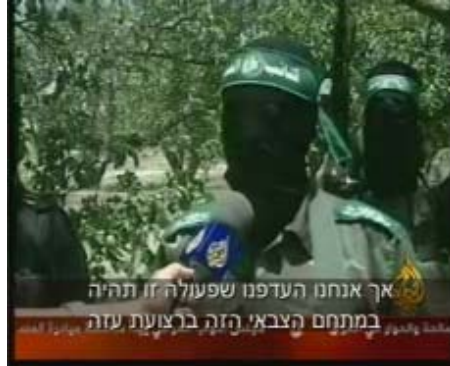
Le porte-parole des Bataillons Izzedine al-Qassam salue l'attaque (Télévision Al-Jazeera, 25 juin).