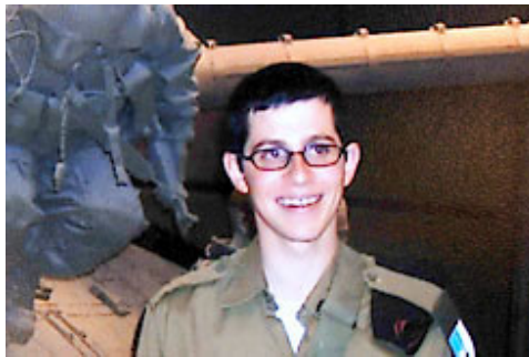
Le soldat enlevé, le caporal Gilad Shalit

⊗ Les trois organisations qui ont revendiqué la responsabilité de l'attaque ont publié un communiqué demandant la libération de toutes les prisonnières et des prisonniers mineurs détenus en Israël. En échange, Israël recevra des informations sur le sort du soldat enlevé (Site Internet des Brigades Izzedine al-Qassam, 26 juin). Note: selon Haaretz du 27 juin, il y a 313 détenus mineurs dans les prisons israéliennes, dont 91 ont du sang sur les mains, et 109 femmes, dont 64 ont du sang sur les mains.