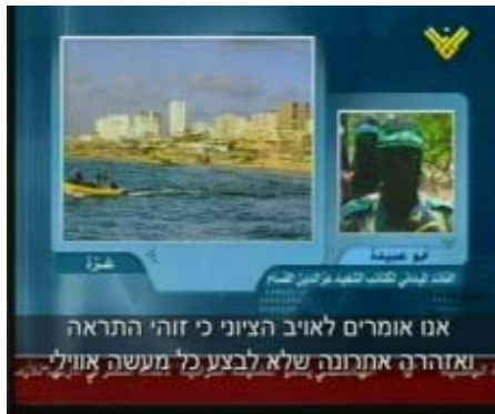
Le porte-parole des Brigades Izzedine al-Qassam transmet la demande des preneurs d’otage et avertit les sionistes de ne “rien faire de stupide” (Télévision Al-Manar, 26 juin).