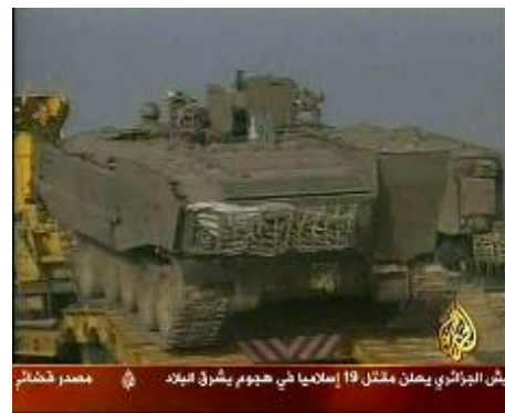
Les forces de Tsahal se concentrent aux portes de la bande de Gaza (Télévision Al-Jazeera, 26 juin).