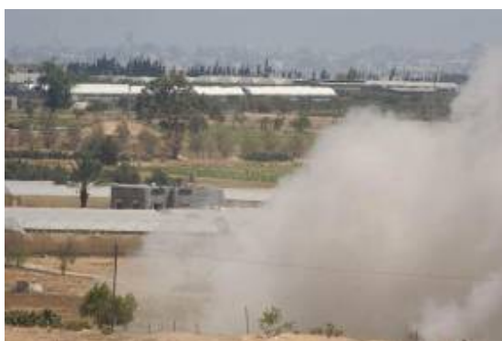
Destruction du tunnel

⊙ Le 26 juin au matin, les forces de Tsahal ont fait exploser le tunnel utilisé par le groupe de terroristes palestiniens qui s'était infiltré en territoire israélien. L'entrée du tunnel a été découverte dans une maison palestinienne à 350 mètres de la barrière séparant la bande de Gaza d'Israël.