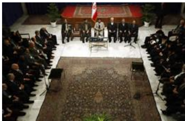
Conférence internationale de négation de l'Holocauste à Téhéran, point culminant de la campagne iranienne de négation de l'Holocauste. Au centre, Ahmadinejad avec les participants de la conférence (12 décembre 2006).