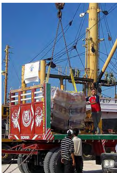
L'Amalthea (Amal) décharge sa cargaison dans le port d'El Arish (Site Internet du Hamas Palestine-info, 18 juillet 2010)