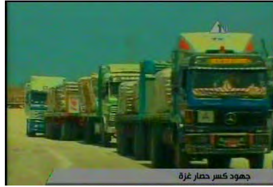
Gauche : Passagers de l'Amalthea (Amal) à une réception avec Ismail Haniya (Télévision du Hamas Al-Aqsa, 18 juillet 2010). Droite : Camions chargés de marchandises de l'Amalthea franchissant le terminal de Rafah (Télévision Al-Aqsa, 18 juillet 2010)

■ Malgré les déclarations selon lesquelles la destination finale du bateau était le port d'El Arish (Press TV, 13 juillet 2010 ; AFP, 10 juillet 2010), des sources officielles du Hamas et les organisateurs du bateau continuent à prétendre que la destination originale était le port de Gaza et que le bateau a changé de cap suite à la pression d'Israël :