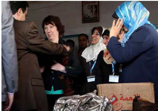
Visite de Catherine Ashton dans la bande de Gaza (sdapem.wordpress.com, 19 juillet 2010)

■ Ashton a appelé à la libération du soldat franco-israélien Gilad Shalit et à permettre à la Croix-Rouge de lui rendre visite. Elle s'est dite opposée à l'envoi de nouvelles flottilles dans la bande de Gaza et a appelé à l'ouverture des terminaux, qualifiant le "siège" de la bande de Gaza "d'inacceptable et inutile." Elle a également exprimé son soutien à l'établissement d'un Etat palestinien et a déclaré que la position de l'Union Européenne était que la bande de Gaza devrait faire partie d'un Etat palestinien (RTTNEWS, 19 juillet ; agence de presse Wafa, 18 juillet ; site Internet de l'UE, 18 juillet 2010).