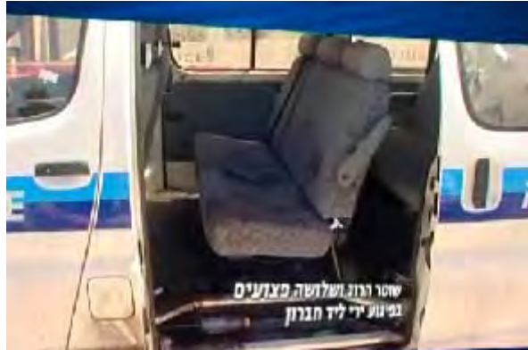
Le véhicule de police après l'attaque à Hébron dans laquelle un policier israélien a été tué (Photo publiée avec l'aimable autorisation de la 10ème chaîne, 14 juin 2010)

■ L'interrogatoire a révélé que la cellule planifiait d'effectuer d'autres attaques terroristes, y compris l'enlèvement d'un soldat ou d'un civil dans le secteur du Goush Etzion au Nord du Mt. Hébron . À cette fin, les membres ont patrouillé dans le secteur et ont même acheté des perruques ainsi que des calottes pour prendre l'apparence de Juifs Orthodoxes (Site Internet des services de sécurité générale, 19 juillet 2010).