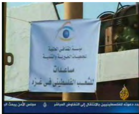
Emblème de la fondation libyenne attaché au bateau