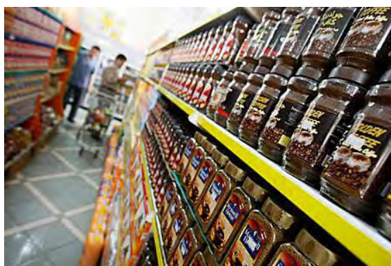
Supermarché de la bande de Gaza (Site Internet UAE News, 8 juillet 2010)

■ Des sources du secteur privé de la bande de Gaza ont déclaré craindre que la politique israélienne de levée des restrictions ne mène à la concurrence avec les marchandises d'Israël, et ont appelé à limiter les importations d'Israël. Ainsi, selon des professionnels de l'industrie du bois, les importations de meubles doivent être limitées. Les fabricants de boisson non-alcoolisée dans la bande de Gaza ont dit craindre de devoir fermer leurs usines à cause de la nouvelle politique israélienne, qui permet l'importation de boissons non-alcoolisées. Ils ont affirmé qu'ils pourraient répondre aux besoins du marché local, mais ne pouvaient pas rivaliser avec les prix des produits israéliens et ont invité l'administration de facto du Hamas à garder les boissons non-alcoolisées israéliennes hors de la bande de Gaza (Felesteen quotidien du Hamas, 4 juillet 2010).