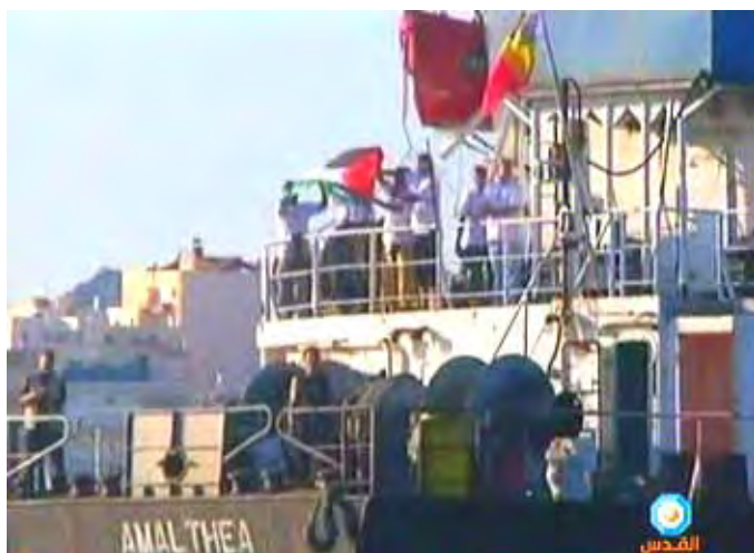
L'Amalthea (Amal) prend la mer (Télévision Al-Quds, 11 juillet 2010)