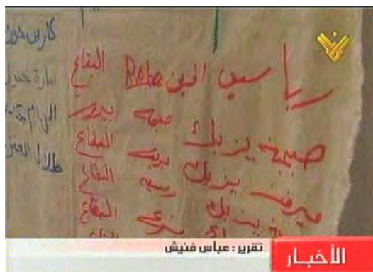
La liste des passagers à bord du Maryam publiée dans la presse (Télévision Al-Manar, 20 juin 2010)

B. Le Maryam – Cargo qui devrait transporter entre 50 et 60 femmes du Liban, du Japon, de Chine, des États-Unis et des pays européens et arabes, y compris un certain nombre de nonnes . Sa cargaison contiendra de l'aide humanitaire, particulièrement des médicaments. La présence de femmes à bord vise à créer des difficultés supplémentaires face à une tentative israélienne d'arrêter le bateau.