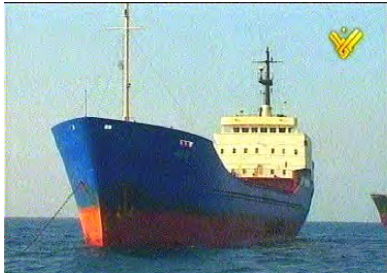
Le Julia (dont le nom a été changé en Nagi al-Ali)