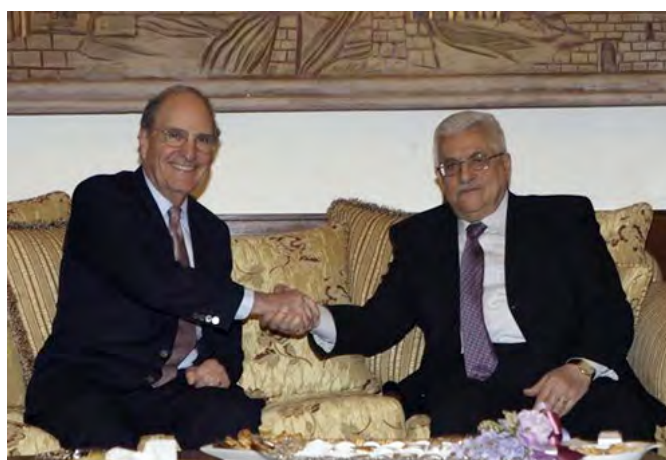
L'émissaire spécial américain au Proche-Orient George Mitchell et le Président de l'Autorité Palestinienne en Jordanie (Agence de presse Wafa, 24 janvier 2010)