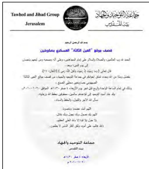
La revendication de responsabilité publiée par le réseau 1

■ Des tirs sporadiques de roquettes et d'obus de mortier ont été signalés dans la bande de Gaza au cours de la semaine. Deux roquettes se sont abattues dans des terrains vagues dans le Néguev occidental les 20 et 24 janvier. Il n'y a eu ni blessé ni dégât. La responsabilité du tir du 20 janvier a été revendiquée par un réseau appelé Groupe Tawhed et Jihad, Jérusalem (Site Internet Al-Mukhtasar, 20 janvier 2010).