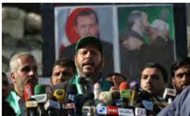
Khalil al-Hayeh, membre du bureau politique du Hamas, en visite en Iran (Agence de presse Fars, Iran, 17 janvier 2010)

■ Khalil al-Hayeh , membre du bureau politique du Hamas, a déclaré pendant une visite en Iran , que le pays versait au Hamas un soutien financier, et apportait un soutien moral et politique . 4 Il a également affirmé que ce soutien était inconditionnel , ajoutant que le Hamas "salue et est fier de tous les types de liens stratégiques islamiques et arabes qui soutiennent les Palestiniens et leur soulèvement" (Asr Iran, 20 janvier 2010).