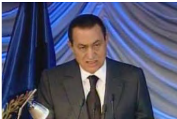
Le Président égyptien Hosni Moubarak : l'Égypte a le droit et le devoir de protéger sa sécurité nationale (Télévision Al-Arabiya, 24 janvier 2010)

absolue. Nous n'accepterons pas que quiconque intervienne, lutte contre nous ou parle avec nous à ce sujet. C'est le droit, le devoir et la responsabilité de l'Égypte comme État, et ceux de tous les États de contrôler leurs frontières et d'assurer leur sécurité contre des menaces d'ennemis aussi bien que d'amis." "Nous complétons la construction des installations et des fortifications le long de notre frontière. Elles ne nuisent à personne, mais protègent notre sécurité nationale de violations desquelles nous sommes familiers et d'activités terroristes comme celles que nous avons vues à Taba, Sharm el-Sheik, Dahab et au Caire (Télévision égyptienne, 24 janvier 2010).