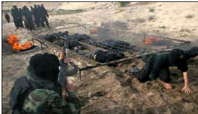
Entraînement des membres de la branche militaro-terroriste du Jihad Islamique Palestinien