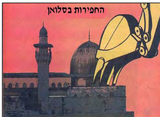
Les excavations à Silwan représentées comme un moyen de détruire Al-Aqsa (Al-Ayam, 20 janvier 2010)