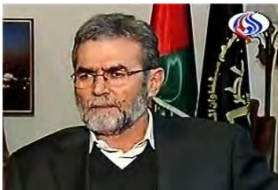
Ziyad Nakhaleh, vice secrétaire général du Jihad Islamique Palestinien (Télévision Al-Alam, 16 novembre 2009)

■ Ziyad Nakhaleh a déclaré que le Jihad Islamique Palestinien n'avait pas décidé de reprendre d'activités intensives ou de tirer des roquettes contre Israël, mais que d'autre part, aucune décision n'avait été prise au sujet d'un cessez-le-feu formel . Il a indiqué que la situation demeurerait comme telle jusqu'à ce que les circonstances soient créées pour permettre de réagir [aux actions d'Israël]. Il a ajouté que l'organisation n'était pas intéressée par un accord d'accalmie formel ou par l'arrêt des tirs de roquettes, parce qu'elle n'abandonnera pas le droit à "résister." Il a également démenti que le JIP avait récemment tiré des roquettes (Al-Watan, 13 janvier 2010).