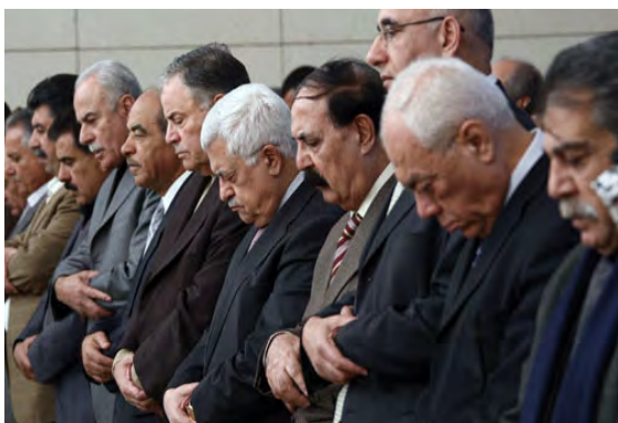
Prières du vendredi à la mosquée Yasser Arafat à Ramallah