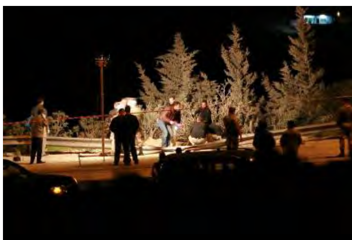
La police jordanienne examine la scène de l'explosion après une attaque avortée contre un convoi de diplomates israéliens (Muhammad Hamad, Reuters, 14 janvier 2010)