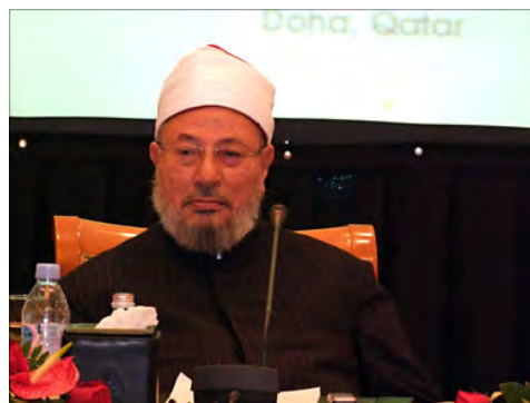
Cheik Dr. Yusuf al-Qardawi, personnalité religieuse sunnite, a utilisé le Rapport Goldstone pour diffamer le Président de l'Autorité Palestinienne Mahmoud Abbas