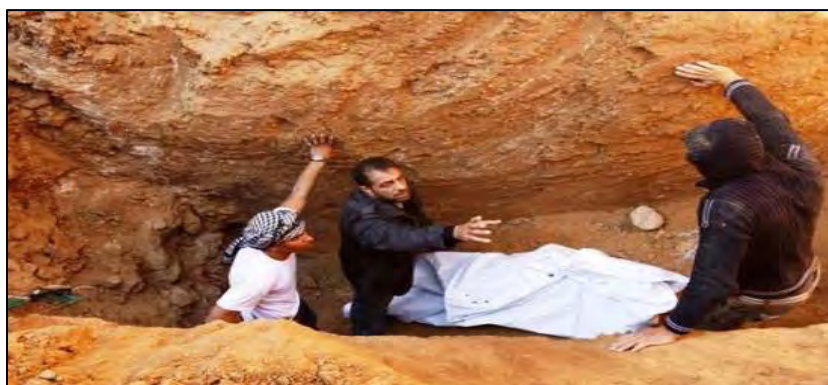
Evacuation du corps d'un des trois Palestiniens tués lors d'une frappe de l'armée de l'air israélienne sur un tunnel de Rafah (Site Internet Filastin Al-Yawm, 9 janvier 2010)

✓ Un tunnel de contrebande d'armes dans la bande de Gaza près du terminal de Rafah. Selon les médias palestiniens, trois Palestiniens ont été tués et six autres ont été blessés (Al-Risala, Agences de presse Ma'an et Wafa, 8 janvier 2010).