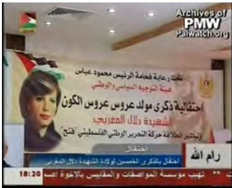
Poster pour la célébration de l'anniversaire de la terroriste Dalal al-Maghribi, organisée sous l'égide de Mahmoud Abbas

Expressions de la lutte politique et de l'incitation à la haine de l'Autorité Palestinienne contre Israël