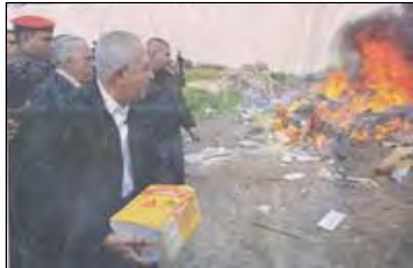
De manière symbolique, Salam Fayyad jette au feu des marchandises fabriquées dans les implantations israéliennes (Al-Ayam, 6 janvier 2010)