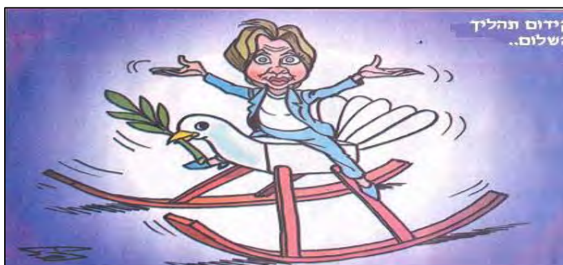
Tentatives américaines de promouvoir le processus de paix (Al-Ayam, 10 janvier 2010)

■ Le Comité Central du Fatah , qui s'est réuni le 11 janvier, a réitéré sa demande de renouveler les négociations avec Israël au point où elles ont été arrêtées, mais seulement après un gel complet de la construction dans les implantations et à Jérusalem (Agence de presse Wafa, 12 janvier 2010).