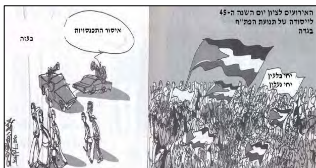
Caricature critiquant l'interdiction du Hamas d'organiser des manifestations dans la bande de Gaza à l'occasion du 45ème anniversaire de la fondation du Fatah. A gauche, la bande de Gaza, à droite, la Judée-Samarie (Al-Quds, 3 janvier 2010).