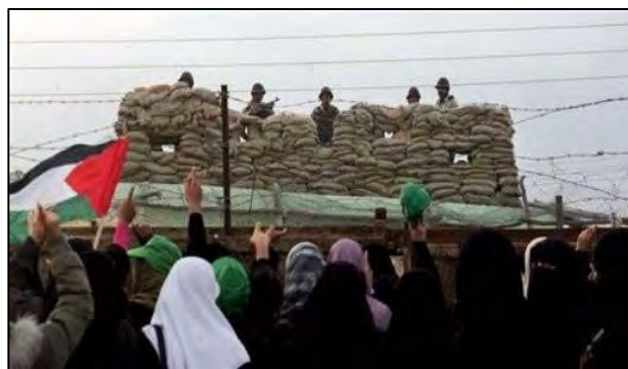
Critique de la barrière par le Hamas (Filastin al-'Aan, 29 décembre 2009)