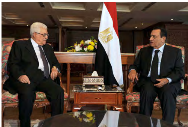
Le Président égyptien Hosni Mubarak et Mahmoud Abbas à Sharm el-Sheikh (Agence de presse Wafa, 4 janvier 2010)