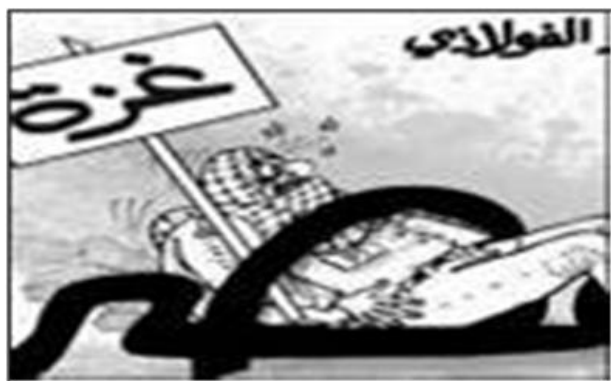
Femmes au terminal de Rafah manifestant contre la barrière (Filastin al-'Aan, 4 janvier 2010)

■ De son côté, la presse gouvernementale égyptienne a justifié la construction de la barrière, critiquant vivement le Hamas et les Frères Musulmans en Egypte pour avoir lancé " une campagne de diffamation dirigée par l'Iran contre l'Egypte " (Al-Gomhuriyya, 29 décembre 2009). Selon un éditorial, le Hamas essaie "d'exporter sa crise en Egypte" (Al-Gomhuriyya, 4 janvier 2010). D'après le journal, malgré le fait que les activités de construction sont surveillées par les forces de sécurité égyptiennes, cela ne signifie pas que la frontière est fermée. Le rédacteur en chef d'Al-Gomhuriyya a affirmé que la barrière était construite pour mettre un terme aux réclamations d'Israël et des États-Unis selon lesquelles les tunnels sous la frontière sont utilisés pour faire passer des armes en contrebande dans la bande de Gaza, ce qui pourrait inciter Washington à imposer des sanctions à l'Egypte (Al-Gomhuriyya, 4 janvier 2010).