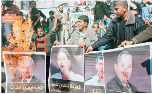
Anniversaire de l'Opération Plomb Durci dans la bande de Gaza (Site Internet Felesteen, 28 décembre 2009)