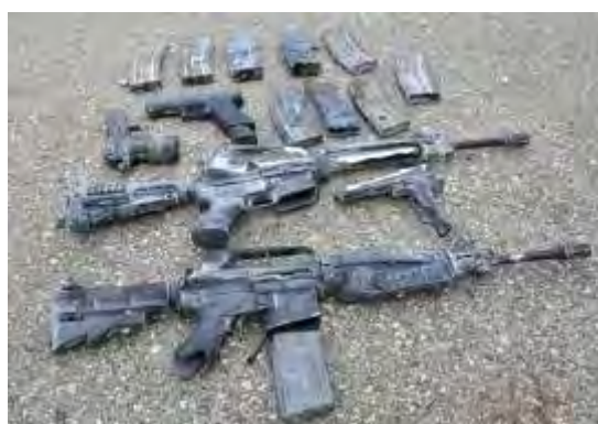
Une partie des armes trouvées à Naplouse (Porte-parole de Tsahal, 27 décembre 2009)

■ Immédiatement après l'attaque, les forces de Tsahal ont passé le secteur au peigne fin pour tenter de localiser les auteurs du tir. Deux jours plus tard, un détachement de l'armée israélienne est entré dans la Casbah (la vieille ville) de Naplouse afin d'arrêter les terroristes qui avaient effectué l'attaque. Plusieurs heures plus tard, les soldats ont entouré le bâtiment où les terroristes se cachaient et, puisqu'ils ont refusé de se rendre, les militaires n'ont pas eu d'autre choix que d'ouvrir le feu en leur direction. Au cours des échanges de tirs, les trois terroristes ont été tués. Dans la cachette de l'un d'entre eux, les soldats ont trouvé l'arme à feu qui avait servi à tuer Meir Avshalom Hai.