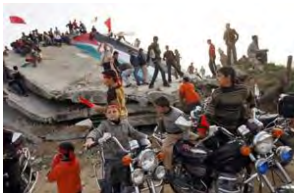
Événements marquant l'anniversaire de l'Opération Plomb Durci dans le camp de réfugiés de Jabaliya (Télévision Al-Quds, 26 décembre 2009).

● Abu Obeida , porte-parole des Brigades Izz al-Din al-Qassam, a déclaré qu'Israël avait désespérément essayé de nuire à la puissance militaire du Hamas et que les Brigades al-Qassam poursuivaient la voie de la "résistance" [cf., le terrorisme] et du jihad. Il a ajouté que l'unité du peuple palestinien, sa patience et sa position ferme avaient considérablement aidé "la résistance" (Site Internet des Brigades Izz al-Din al-Qassam, 27 décembre 2009).