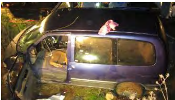
Le véhicule du défunt Meir Avshalom, visé par des tirs dans une embuscade au Nord de la Samarie