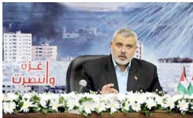
Ismail Haniya s'exprimant d'un studio fermé pour l'anniversaire de l'Opération Plomb Durci

● Ismail Haniya , le chef de l'administration de facto du Hamas, a déclaré qu'Israël n'avait pas atteint ses objectifs et que les Palestiniens s'étaient rétablis, ajoutant que le gouvernement du Hamas et les forces de sécurité avaient effectué leurs devoirs et que la "résistance" existe toujours. Il a également ajouté que la reconstruction de la bande de Gaza n'avait pas encore été achevée puisque les fonds nécessaires ne sont pas arrivés sur place en raison de ce qu'il a appelé "la politisation" de la reconstruction.