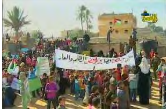
Enfants manifestants à Rafah (26 décembre 2009)