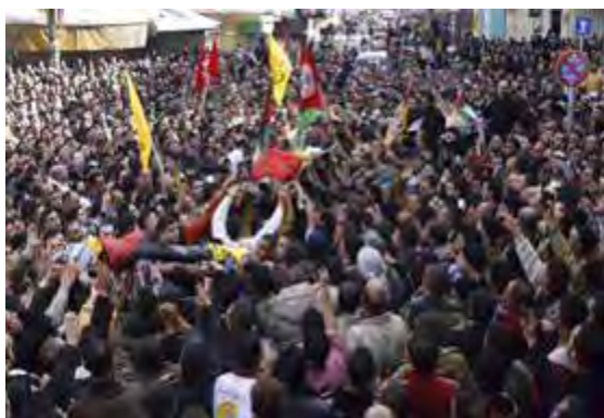
Funérailles des membres des Brigades des Martyrs d'Al-Aqsa du Fatah