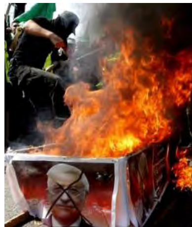
Cercueil en feu décoré de portraits de Mahmoud Abbas (Al-Quds, 9 octobre 2009)