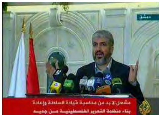
Khaled Mashaal parlant à Damas (Télévision Al-Jazeera, 11 octobre 2009)

■ Le Comité Central du Fatah a déclaré que le discours de Khaled Mashaal témoignait d'une "escalade qui ne prend pas en considération les intérêts des Palestiniens et est une attaque sérieuse contre les tentatives faites pour arriver à une réconciliation et à un accord" (Agence de presse Ma'an, 12 octobre 2009).