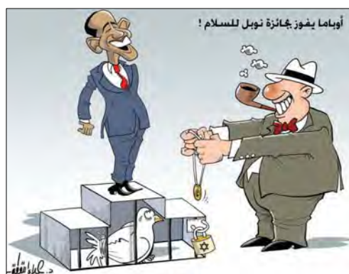
Obama reçoit le Prix Nobel de la Paix avec la Colombe de la Paix emprisonnée à ses pieds (Felesteen du Hamas, 11 octobre 2009)

● L'administration Obama : Khaled Mashaal a déclaré qu'au début de son mandat, l'administration Obama avait utilisé "un langage différent" et fait preuve de signes positifs, mais n'avait pas traduit ses paroles en actes. Obama, a-t-il dit, a reçu le Prix Nobel pour sa rhétorique fleurie et pour ses promesses qui n'ont pas été respectées : "L'administration Obama nous a donné des mots et a donné des actes à nos ennemis," et ainsi les Palestiniens n'ont aucun soutien dans leur lutte contre Israël.