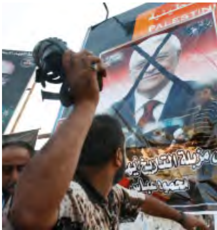
Lancement d'une chaussure sur une affiche de Mahmoud Abbas dont le visage a été barré d'un X. La légende précise, "Allez dans la poubelle de l'Histoire, Mahmoud Abbas le traître" (Site Internet Al-Akhbar libanais, 8 octobre 2009)

Campagne d'incitation du Hamas contre Mahmoud Abbas suite au Rapport Goldstone