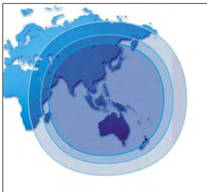
Zones de transmissions du satellite (Site Internet de la société)

émet en Indonésie, en Malaisie, aux Philippines, en Corée, en Australie, en Nouvelle-Zélande et dans les îles plus petites du Pacifique du Sud-ouest, au Japon, en Chine, en Inde, en Russie du Sud, en Iran et en Asie Centrale, aussi bien que dans des régions du Moyen-Orient et d'Afrique. IndoSat était à l'origine gouvernemental, mais en 2003 le gouvernement a vendu la plupart de ses actions. Aujourd'hui Qatar Telecom (Qtel) détient environ 65 % des actions, directement et indirectement.