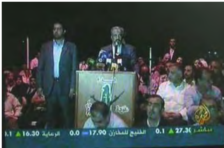
Discours de Khaled Mash'al à la cérémonie de clôture d'une colonie de vacances organisée par le FPLP-CG (Al-Jazeera, 2 août 2010)

1. Le 2 août 2010, Khaled Mash'al a prononcé un discours guerrier et agressif à la cérémonie de clôture d'une colonie de vacances à Damas organisée par le FPLP-CG d'Ahmed Jibril. Dans le discours, il a appelé à poursuivre le jihad et la "résistance" (cf., la violence et le terrorisme) contre Israël, et a exprimé un refus absolu à toutes négociations, directes ou indirectes.