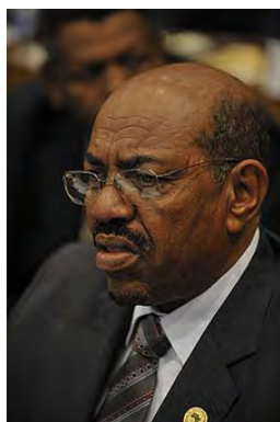
Le Président soudanais Omar al-Bashir (Wikipedia, 15 juillet 2010)

2. Le soutien du Hamas au Président soudanais en dépit des accusations sérieuses de génocide, ainsi que ses propos véhéments contre le système international de justice, sont particulièrement choquants au vu de ses tentatives pour saper la légitimité de l'État d'Israël et de ses dirigeants. Ces efforts incluent notamment le recours aux systèmes judiciaires internationaux et nationaux dans l'intention de poursuivre en justice de hauts fonctionnaires israéliens.