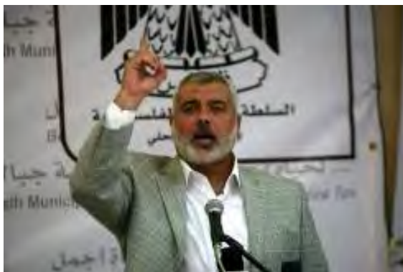
Discours d'Haniyah à la cérémonie d'appellation de la rue (Palestine-info, 15 juillet 2010)

Le texte original en arabe du communiqué (Ma'an, 14 juillet 2010)