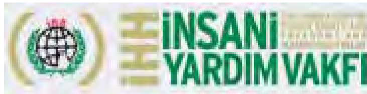
Le logo de l'organisation

1. La participation turque dans la flottille actuelle est certaine, par l'intermédiaire de l'organisation IHH , une organisation turque des droits de l'Homme pro-palestinienne de tendance islamique (son nom complet est Insani Yardim Vakfi). Il s'agit d'une ONG dont le but est de mener des opérations dans des régions sinistrées pour sauver des vies et empêcher les violations des droits de l'Homme. L'organisation opère dans les pays arabes et musulmans comme l'Irak, la Palestine, la Jordanie, le Liban, le Pakistan, le Soudan, la Somalie, etc. L'organisation a été établie en 1995 et est dirigée par Bulent Yildirim .