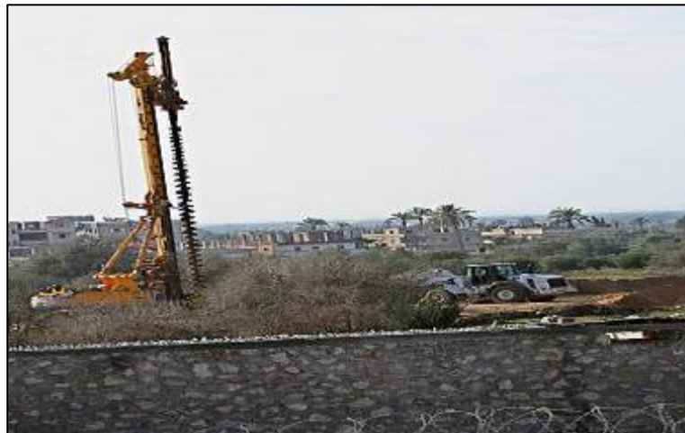
Travaux d'excavation à Rafah pour la construction de la barrière égyptienne (Felesteen, 18 décembre 2009)