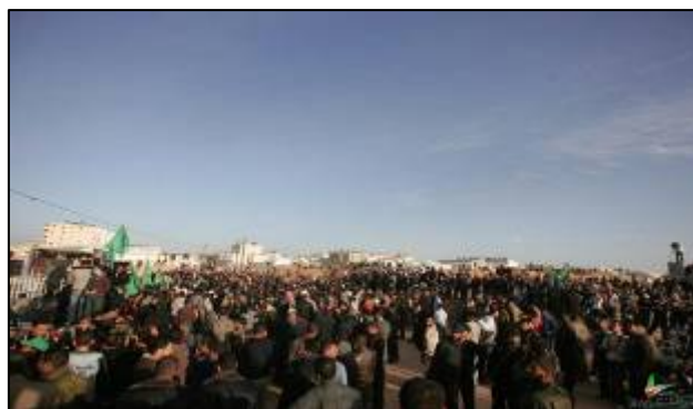
Résidents de la bande de Gaza manifestant à Rafah