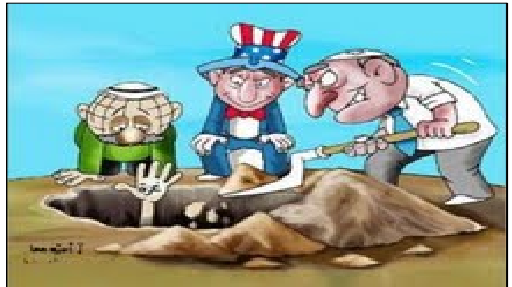
Critique de la coopération entre l'Egypte, Israël et les Etats-Unis sur le "blocus" imposé à la bande de Gaza, sur fond de la construction de la barrière égyptienne (Al-Risala, 21 décembre 2009)

8. Ci-dessous un extrait des déclarations des responsables du Hamas :