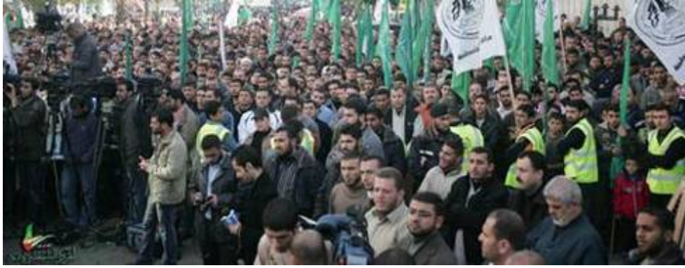
Manifestation du Hamas à Gaza contre le "mur de fer" (Forum PALDF, 25 décembre 2009)