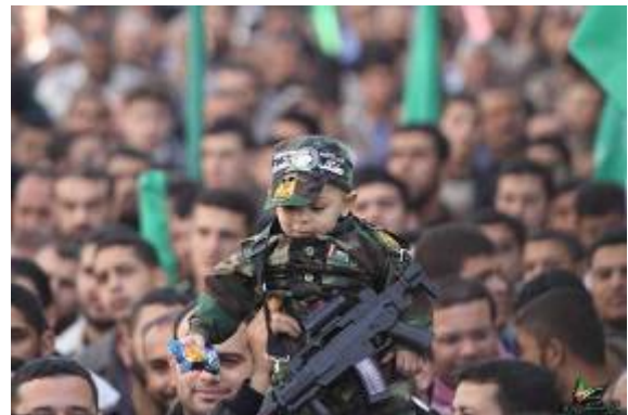
Manifestation du Hamas à Gaza contre le "mur de fer" (Forum PALDF, 25 décembre 2009)

c. Comme de coutume, le Hamas a enrôlé les enfants dans ses activités de protestation. Des centaines d'enfants ont manifesté devant le terminal de Rafah contre la construction du "mur." Les enfants ont scandé des slogans contre le "mur" et les mesures prises par l'Egypte (Oudsnet, 26 décembre 2009).