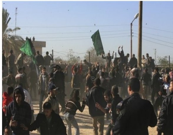
Heurts violents entre les manifestants du Hamas et les forces égyptiennes à Rafah (Filastin al-Aan, 6 janvier 2010)