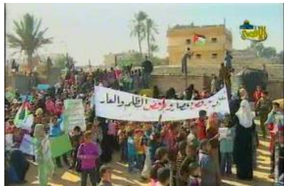
Enfants manifestant devant le terminal de Rafah