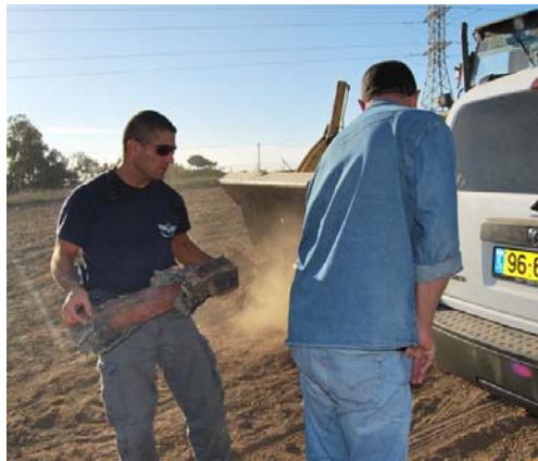
Un démineur de la police israélienne transporte une roquette tombée dans un terrain vague (Zeev Trachtman, 5 décembre 2008)

Escalade des violences dans la bande de Gaza: les 5 et 6 décembre, sept roquettes et huit obus de mortier ont été tirés, détériorant encore la trêve, régulièrement violé par les organisations terroristes palestiniennes depuis le début du mois de Novembre 2008.