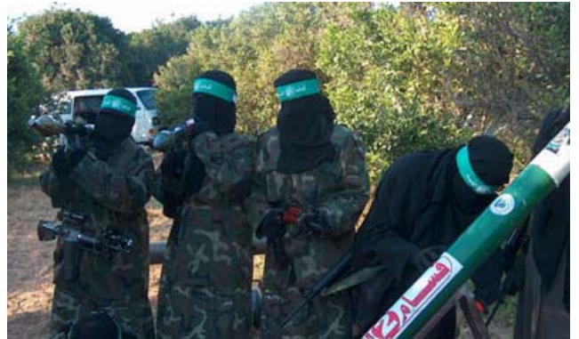
Activistes du Hamas avant un tir de roquette. Les activistes portent de longues robes et le voile. Deux d'entre elles portent un lanceur RPG