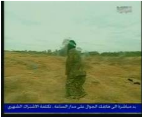
Lancement d'une grenade au cri de "Allah Akbar"

légères, au lancer de grenades, à l'embuscade et à l'assaut de soldats de Tsahal. Selon le journaliste : " chaque année, des douzaines de femmes de la bande de Gaza suivent une formation militaire , y compris des étudiantes, des mères et des femmes qui travaillent. Elles savent que leur rôle dans le conflit n'est pas limité aux soins apportés aux blessés et aux enfants. [Elles savent] que ce qu'elles font peut changer l'équilibre des forces [entre les Palestiniens et Israël]." Ci-dessous plusieurs images du reportage diffusé par la chaîne NTV :