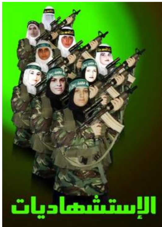
Affiche intitulée "Femmes terroristes suicide" (Al-Istishadiyyat) consacrée aux femmes palestiniennes ayant commis des attentats suicide. En 2008, elle a été publiée en première page du site Internet du Hamas Palestine-info.

Dans le cadre de la réorganisation militaire des mouvements terroristes dans la bande de Gaza, des femmes sont formées au combat et aux attaques suicides. Le Hamas et le JIP ont autorisé des médias à filmer des combattantes féminines durant la trêve. De tels messages ont pour objectif de dissuader Israël d'entrer dans la bande de Gaza dans l'avenir.