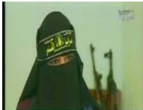
La "femme qui désire Jérusalem", membre des Brigades de Jérusalem (NTV, 19 août 2008)

7. Dans un reportage diffusé sur la chaîne de télévision libanaise NTV (19 août 2008), une activiste des Brigades de Jérusalem du JIP, auto-baptisée " Ashiqat Al-Quds " (cf., la femme qui désire Jérusalem), a présenté une ceinture explosive prête à l'emploi et a fait part de son désir de se faire exploser au milieu de soldats de Tsahal en cas d'action militaire israélienne dans la bande de Gaza.