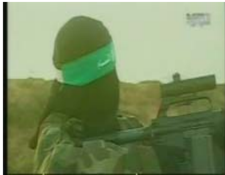
Tir d'un fusil équipé d'une lunette télescopique

6. Ci-dessous des photographies prises avant la trêve de femmes membres du Hamas en formation et sur le terrain. Les photographies ont été publiées sur le forum Internet de la chaîne de télévision populaire Al-Jazeera (31 janvier 2008).