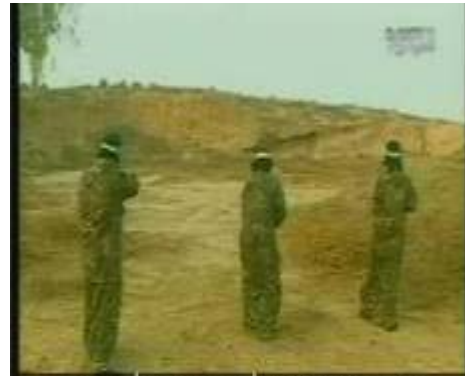
Tirs à l'arme légère