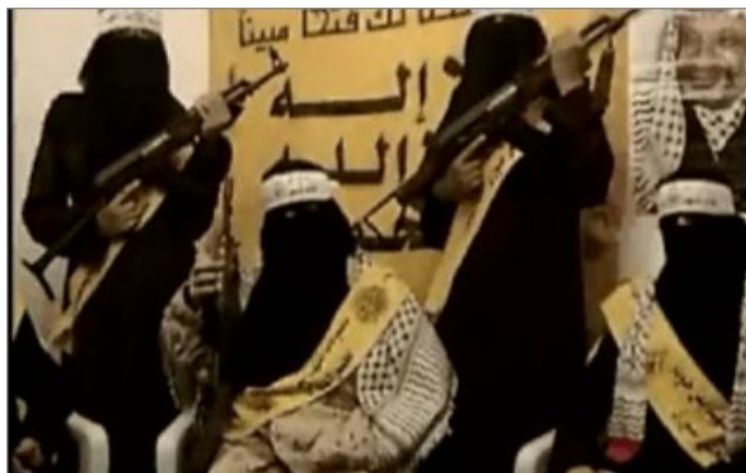
Femmes membres des réseaux des Brigades des Martyrs d'Al-Aqsa du Fatah