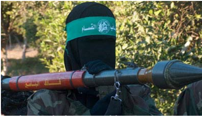
Une activiste du Hamas porte un lanceur RPG