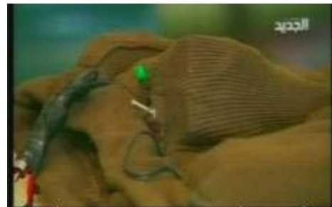
La ceinture explosive de la "femme qui désire Jérusalem" (NTV, 19 août)