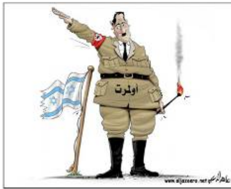
Ehud Olmert sous les traits d'Adolf Hitler (Page d'accueil du site Internet d'Al-Jazeera, 4 mars 2008)

contre les Palestiniens (au bas de la couverture le mot anglais "holocauste" apparaît, traduit en arabe). Pendant l'Opération Hiver Chaud, la chaîne qatari populaire Al-Jazeera a également joué un rôle, en diffusant le terme "holocauste" nuit et jour au monde arabo-musulman (et aux Arabes israéliens aussi), comparant Israël au régime nazi. 6