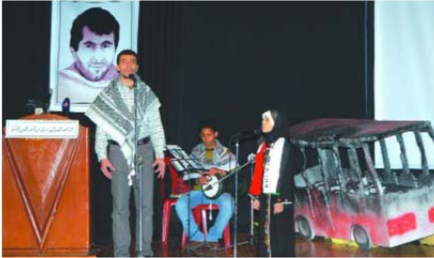
Représentation des Faucons Al-Aqsa, avec en fond la maquette d'un autobus saccagé et une photographie d'Yahya Ayyash.