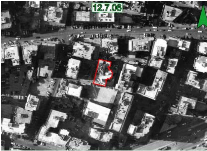
Photographie aérienne de la chaîne de télévision Al-Manar à Harat Hreik, dans la banlieue chi'ite du sud de Beyrouth, attaquée par Tsahal durant la seconde guerre du Liban. La chaîne Al-Manar est un composant clef de "l'empire médiatique" du Hezbollah et une partie inséparable d'un système qui soutient le terrorisme.

12. Les consommateurs de renseignements recueillis en vue de la bataille des cœurs et des esprits ne sont pas nécessairement les consommateurs "classiques" des services de renseignements. Ainsi, les renseignements devraient mettre en place des canaux de communication appropriés par l'intermédiaire desquels, l'information peut circuler régulièrement, directement ou indirectement, à destination des éléments divers impliqués dans la bataille des cœurs et des esprits. Dans le cas d'Israël, ces éléments incluent le Ministère des Affaires étrangères et ses ambassades à l'étranger (les ambassadeurs à l'étranger sont "des soldats" sur le champ de bataille des médias); le porte-parole de Tsahal; les médias israéliens et étrangers; les instituts de recherche et d'information; les ONG juives et non-juives à l'étranger qui œuvrent en faveur d'Israël. Les services de renseignements doivent mettre en place une relation réciproque intime avec les individus et les organismes engagés dans la bataille des cœurs et des esprits, et les aider à fournir la réponse appropriée. Tous ces organismes n'appartiennent pas à l'establishment gouvernemental politique et sécuritaire et les services de renseignements doivent être enclins à coopérer avec des organes non gouvernementaux dans la bataille des cœurs et des esprits (ces