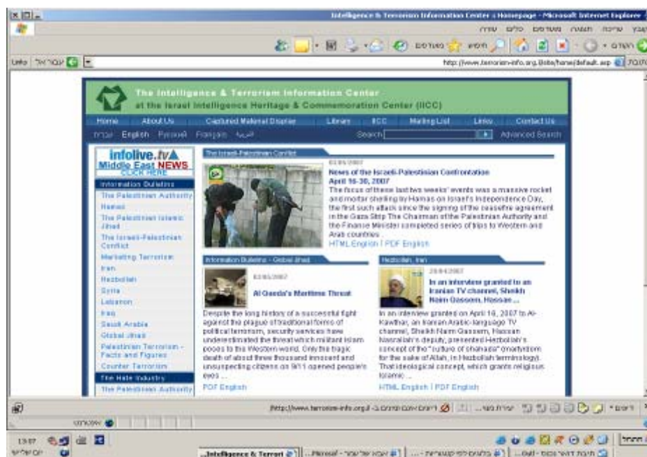
La page d'accueil en anglais du site Internet du Centre : les sites sont le fer de lance de la diffusion des informations sur le terrorisme

21. Les informations sur le terrorisme sont également diffusées par d'autres vecteurs. Le Centre comprend une bibliothèque et un centre informatisé spécialisés dans les renseignements et le terrorisme, ainsi que des archives de documents et objets palestiniens saisis. Ces services sont proposés à l'establishment de la défense et aux visiteurs civils (cf., des experts et des étudiants du monde universitaire) à la recherche d'informations (livres, articles, documents saisis). L'exposition des documents et objets palestiniens saisis est visitée par des centaines de personnes chaque mois. Parmi ces visiteurs on trouve le personnel militaire, des experts en terrorisme, des diplomates, des délégations étrangères et des étudiants.