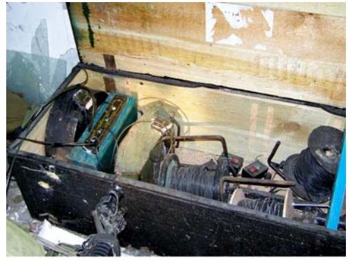
Les armes trouvées pendant l'opération de Tsahal au Nord de la bande de Gaza. Droite: Armes trouvées dans une mosquée dans le quartier de Sajaiya (Porte-parole de Tsahal, 16 avril 2008).

4. Après l'incident, l'armée de l'air israélienne a effectué plusieurs frappes contre des véhicules suspects et contre des individus soupçonnés d'être des terroristes. Les médias palestiniens ont annoncé que 12 Palestiniens avaient été tués et 25 autres blessés lors de ces frappes aériennes. Parmi les tués figure Fadel Shana'a , un photographe de Reuters, qui se trouvait sur place afin de photographier les événements et qui a été tué par erreur . Tsahal a fait part de ses regrets et a annoncé examiner les circonstances de sa mort.