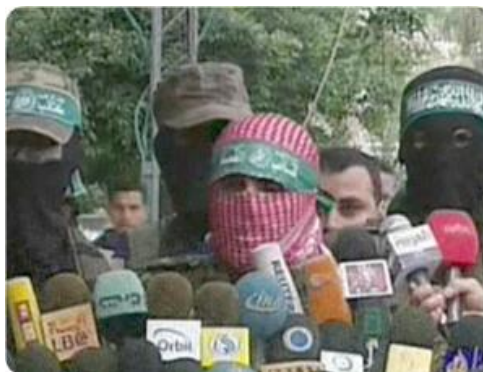
Conférence de presse des Brigades Izzedine al-Qassam (Site Internet Palestine-info, 16 avril 2008).

9. Le gouvernement du Hamas a publié un communiqué officiel dans les journaux, exigeant l'ouverture immédiate du terminal de Rafah et qualifiant les "violences et le terrorisme commis par Israël" "d'holocauste des Palestiniens" (Site Internet Palestine-info, 16 avril 2008).