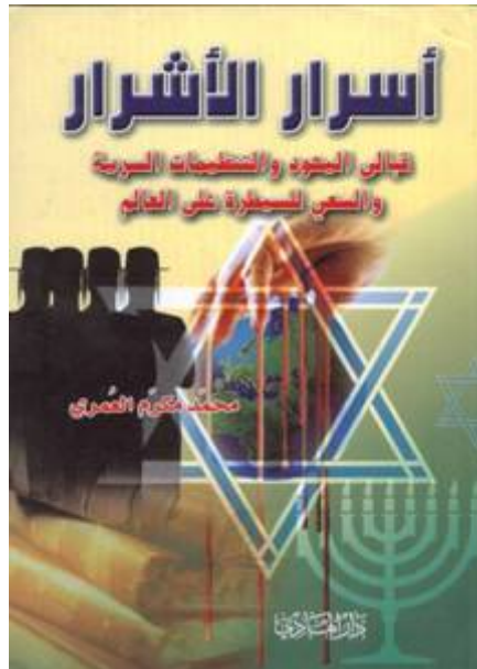
Couverture d'un ouvrage d'incitation à l'antisémitisme intitulé "Les Secrets des Scélérats, la Kabbale juive, les Organisations secrètes et le Désir de Contrôler le Monde." Le livre a été publié au Liban (Beyrouth) par Dar al-Hadi.