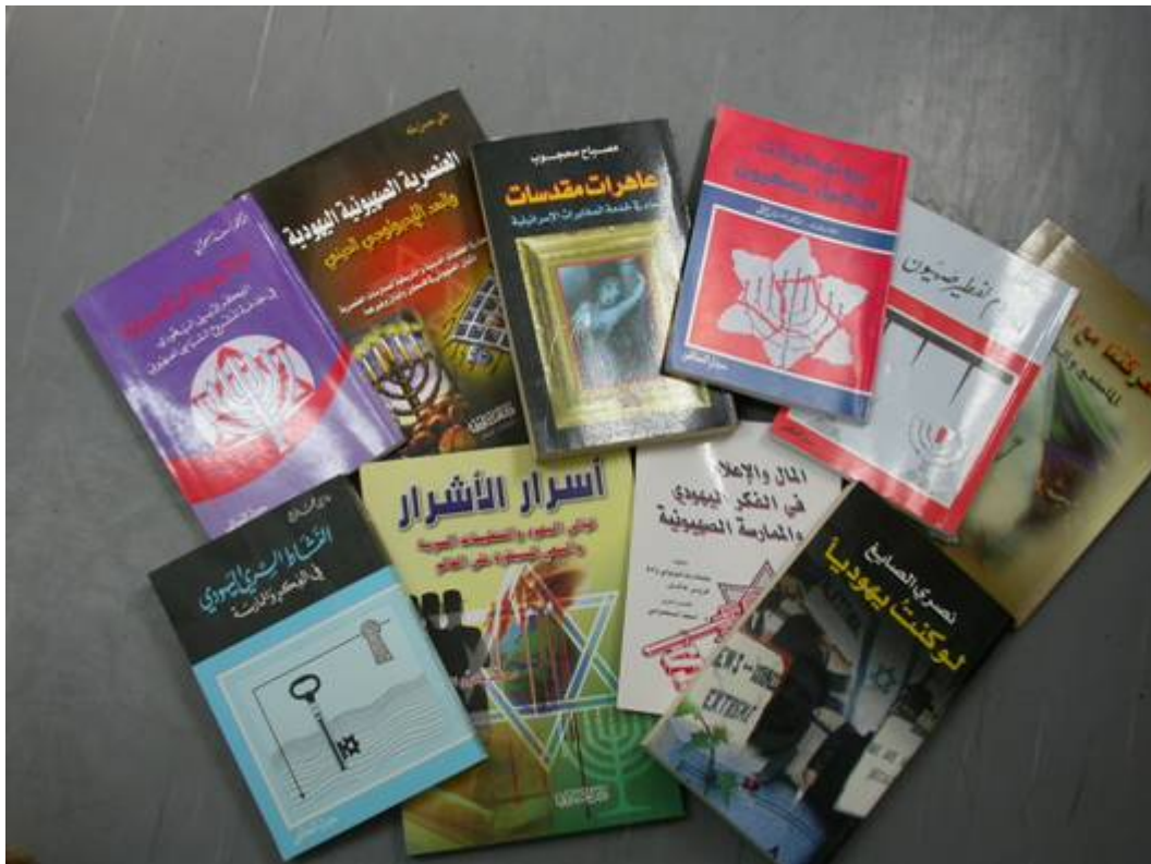
Sélection d'ouvrages antisémites récents publiés au Liban et présentés à la Foire Internationale du livre de Doha au Qatar (Décembre, 2005).

Le Liban continue d'être un centre de diffusion de littérature antisémite, notamment d'ouvrages publiés par la maison d'édition du Hezbollah. Cette littérature, diffusée dans le monde arabo-musulman, incite à la haine et à la violence contre Israël et le peuple juif.