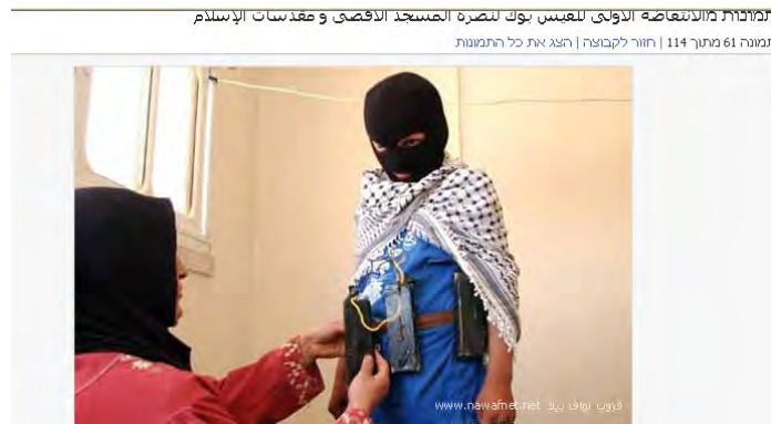
מסרים תומכי טרור בקבוצת פייסבוק: אם מלבישה את בנה רעול הפנים בחגורת נפץ

11. עבור הפלסטינים השימוש ברשת מאפשר קשר ישיר בין רצועת עזה לבין יהודה ושומרון ובינם לבין מדינות במזרח התיכון ומחוצה לו בהם פועלים גורמים אסלאמיים-רדיקאליים וגורמי טרור. מעבר למשמעות התעמולתית זוהי פלטפורמה נוחה לליבוי יצרים ולהסתה. באשר לקהל היעד של רשתות אלה הוא בדרך כלל קהל צעיר הנתון להשפעה של מסרים אלה. הדבר עלול לאפשר לגורמים אסלאמיים רדיקאליים ולגורמי טרור הפעלת צעירים להפרות סדר ביהודה ושומרון בדגש על הר הבית.