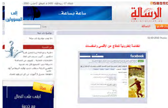
הכתבה שהופיעה באתר ביטאון חמאס אלרסאלה (28 בפברואר, 2010)

5. חברי הקבוצה משתפים את חבריהם לקבוצה במלל, תמונות, כרזות, סרטונים וקישורים שונים הרלוונטיים לנושא. בין השאר מופיע באתר סרטון המתעד נאום שנשא רא"ד צלאח, ראש הפלג הצפוני של התנועה האסלאמית בישראל, במסגרת כינוס "אלאקצא בסכנה" ובו הוא מאשים את ישראל בטרור ובקיום חפירות בהר הבית כדי להקים במקום את בית המקדש השלישי 2 . חברי הקבוצה גם מעדכנים באמצעותו על אירועים מתוכננים דוגמת הפגנות מחאה, עצרות וכינוסים.