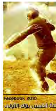
Facebook 2010 عزة القيس بوك الأولى