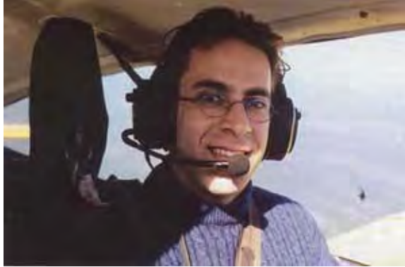
ג'ראח בקורס טייס מעל שמי פלורידה (ויקיפדיה)

11. זיאד ג'ראח, שעל שמו נקראות "הפלוגות" בלבנון הינו לבנוני במוצאו ואחד מ-19 הטוריסטים שביצעו את פיגועי 11 בספטמבר בארה"ב. ג'ראח חי מספר שנים בגרמניה, שם נישא לאישה ממוצא תורכי. מגרמניה עבר לאפגניסטאן ומשם לארצות-הברית, כדי להשתתף בפיגועים. 10