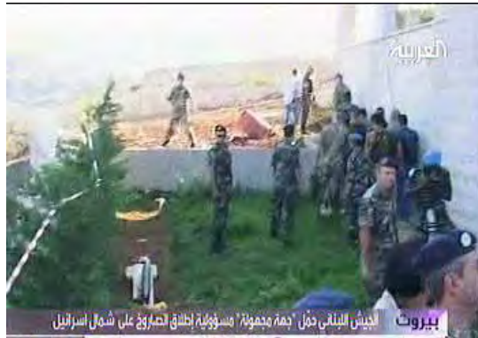
הסריקות בבית בחולא (אלערביה, 28 באוקטובר)

באוקטובר). בפורום הג'יהאד העולמי פורסמה נטילת אחריות להצבתן של חמש רקטות בסביבות כפר חולא (פורום פלוג'ה, 29 באוקטובר 2009).