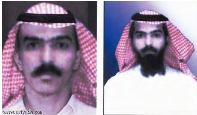
יוסף אלעיירי (אלריאצ', 7 ביוני 2010)

4. יוסף אלעיירי [לפי גרסה נוספת: אלעיארין], שכינויו אלסיף אלבתאר (החרב החדה/החרב הקוטעת/החרב המפלחת), הינו סעודי יליד שנת 1973, שהיה אחד מהאידיאולוגים ומפקדי השטח הבכירים של ארגון אלקאעדה. 3 אלעיירי, נהרג בסעודיה בשנת 2003, לאחר שנלחם באפגניסטן, צ'צ'ניה ובפיליפינים, 4 ועל שמו נקראת שלוחת גדודי עבדאללה עזאם בחצי האי ערב.