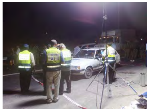
המכונית הפגועה במקום האירוע (צילום: רובי ראובן - דוברות זק"א 31 באוגוסט 2010)