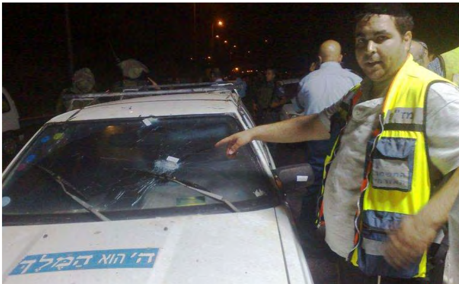
המכונית הפגועה במקום האירוע (צילום: רובי ראובן - דוברות זק"א 31 באוגוסט 2010)

ערב פתיחת הפסגה בארה"ב, שנועדה להתניע את חידוש המשא ומתן הישיר בין ישראל לפלסטינים, בוצע פיגוע ירי לעבר כלי רכב ישראלי דרומית מזרחית לחברון. בפיגוע נהרגו ארבעה אזרחים ישראליים. הזרוע הצבאית של חמאס קיבלה אחריות לביצוע. הרשות הפלסטינית גינתה את הפיגוע. 1