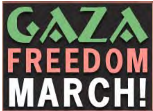
לוגו ההתארגנות הקנדית (אתר הארגון, 27 ביולי 2010)

● קנדה: ההתארגנות הקנדית המכנה עצמה "Gaza Freedom March" החלה בגיוס תרומות לטובת שיגורה של ספינה קנדית, במסגרת "משט החירות 2". אחד ממארגני המשט הדגיש כי אין בכוונתם להתעמת עם ישראל וכי הם אינם תומכים בחמאס אלא בתושבי רצועת עזה (The National Post, 15 ביולי 2010).