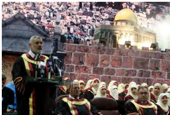
ראש ממשל חמאס אסמאעיל הניה נואם באוניברסיטה האסלאמית בעזה (Palestine-info, 25 ביולי 2010)