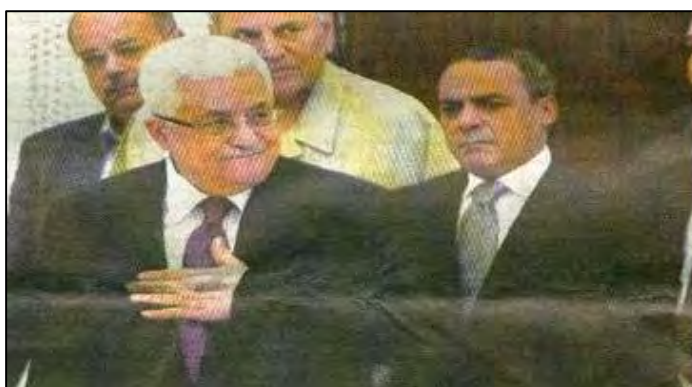
אבו מאזן בישיבת המועצה המהפכנית של פתח בראמאללה (אלקדס, 21 יולי 2010).