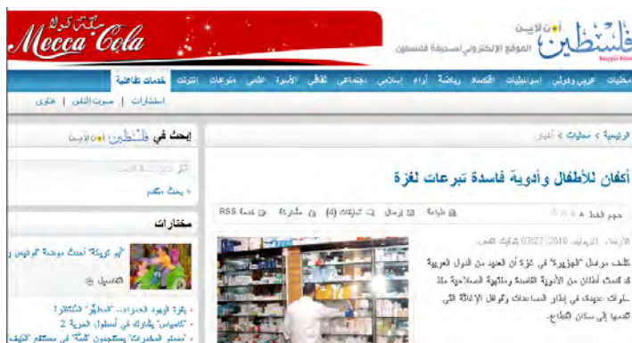
הכתבה כפי שהופיעה ביומון פלסטין 21 ביולי 2010

■ כתב אלג'זירה ברצועת עזה חשף, כי אחראים במשרד הבריאות של ממשל חמאס הביעו תרעומת בשל העובדה שכ-70 אחוזים מכלל התרופות שהגיעו לרצועת עזה במסגרת שיירות הסיוע ממדינות שונות, בעיקר ממדינות ערב, לא היו שמישות. הן היו מקולקלות או שפג תוקפן, בטווחים של חודשים ושנים. כמו כן אמרו, כי באחת משיירות הסיוע הגיעו מכשירי דיאליזה לא שמישים. הכתבה צוטטה גם ביומון פלסטין המזוהה עם ממשל חמאס ברצועה (אלג'זירה, 20 ביולי 2010).