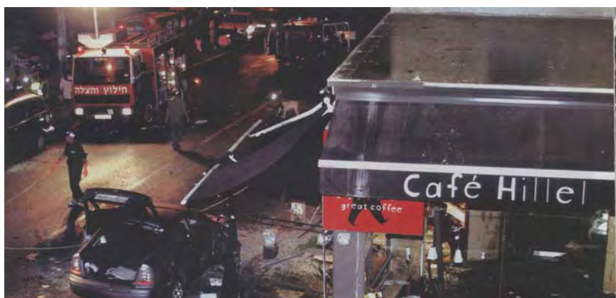
בית הקפה הלל בירושלים בו בוצע פיגוע ההתאבדות (פלסטיין אלמסלמה, אוקטובר, 2003)