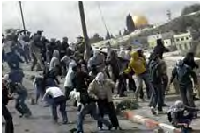
מפגינים פלסטינים במזרח ירושלים (Palestine-info, 16 במרץ)

■ חמאס יצאה בקמפיין הסתה המכוון ללבות את הרוחות סביב נושא ירושלים ולעודד התפרעויות והפרות סדר . במסגרת זאת היא קראה להפוך את ה-16 במרץ ל"יום הזעם והגנה על מסגד אלאקצא וירושלים". חנוכת בית הכנסת "החורבה" (15 במרץ) נוצלה על ידי חמאס ופתח להתססת הציבור הפלסטיני תוך העלאת הטיעון השקרי כי ישראל מתכוונת לפגוע במסגד אלאקצא ולבנות במקומו את בית המקדש השלישי.