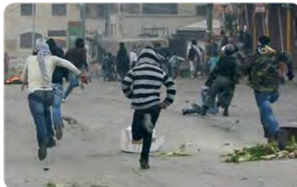
מפגינים פלסטינים במזרח ירושלים (אתר גדודי עז אלדין אלקסאם, 16 במרץ)

■ ב-16 במרץ צוין "יום הזעם והגנה על מסגד אלאקצא וירושלים" בעקבות קמפיין הסתה של חמאס(ראו בהמשך). על רקע זה התלהטו הרוחות ואירעו עימותים אלימים במהלכם נפצעו על פי דיווחים פלסטינים כ-100 מפגינים וכמה עשרות מפגינים נעצרו. במהלך המהומות הושמעו אף קריאות לשוב למאבק המזוין נגד ישראל. "יום הזעם צוין" גם בהפגנת ברצועת עזה.