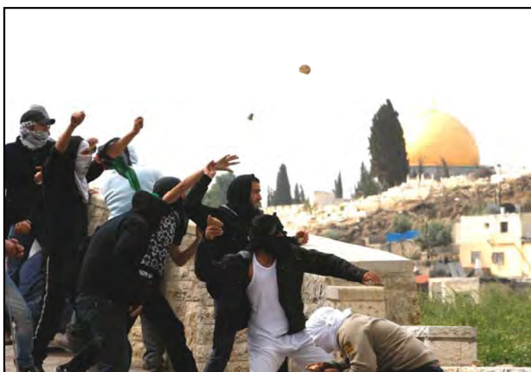
מפגינים פלסטינים מיידים אבנים לעבר כוחות הביטחון בואדי ג'וז סמוך למזרח ירושלים (רויטרס, 16 במרץ. צילום: בז רטנר)