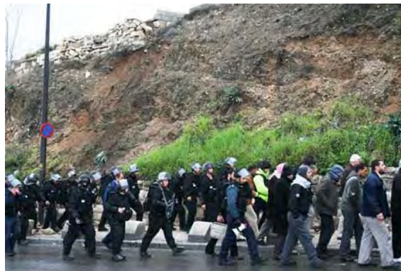
מפגינים מתעמתים עם כוחות משטרה במזרח ירושלים (28 בפברואר)

■ שיאם של האירועים היה ב- 28 בפברואר (חג פורים) בהר הבית בירושלים. במהלך היום פרצו מהומות על רקע טענות פלסטיניות לפיהן מתכננים ארגונים יהודיים להגיע להר הבית כדי להכריז על הנחת אבן הפינה לבית המקדש. עשרות צעירים ערביים החלו ליידות אבנים לעבר מטיילים בהר הבית. בעקבות כך נכנס כוח משטרה למתחם הר הבית. כמה עשרות מתפללים התבצרו במסגד אלאקצא והתעמתו עם כוח המשטרה הישראלי. מאוחר יותר התפשטו העימותים לשכונות נוספות של מזרח ירושלים כגון שכונת ראס אלעמוד וצור באהר. ארבעה שוטרים נפצעו כתוצאה מיידוי האבנים כמו כן נפצעו 18 מפגינים ושבעה נעצרו.