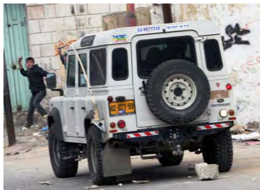
מפגין בחברון מתעמת עם כוח צה"ל (22 בפברואר)

■ גם השבוע נמשכו הפגנות אלימות והפרות סדר בעקבות הכללת מערת המכפלה וקבר רחל ברשימת אתרי המורשת הלאומיים. רוב הפרות הסדר התמקדו בחברון אך הפגנות נערכו גם במספר ערים ביהודה ושומרון וברצועת עזה. להלן עיקרי האירועים בחברון: