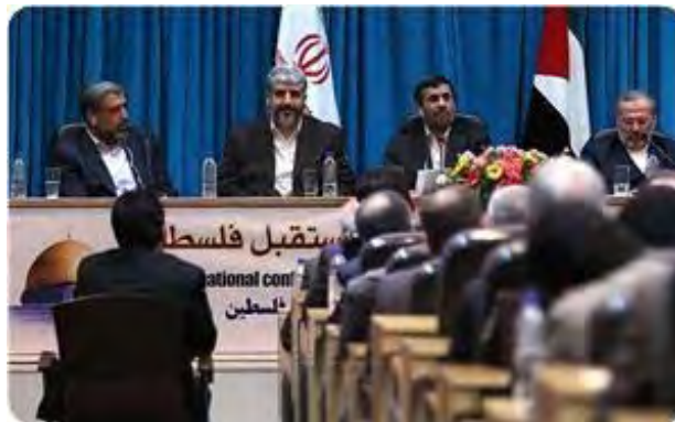
נשיא איראן אחמדי נז'אד במסיבת עיתונאים עם יו"ר הלשכה המדינית של חמאס ח'אלד משעל בכנס "הוועדה לסולידריות לאומית ואסלאמית למען עתיד פלסטין" (Palestine-info, 28 בפברואר, 2010)

■ באיראן התקיים ב-28 בפברואר כינוס של גוף המתקרא "הוועדה לסולידריות לאומית ואסלאמית למען עתיד פלסטין". בכנס נכחו יו"ר הלשכה המדינית של חמאס ח'אלד משעל , מזכ"ל הג'האד האסלאמי בפלסטין רמצי'אן שלח וראש החזית העממית/המפקדה הכללית אחמד ג'בריל . השלושה נפגשו עם מנהיג איראן עלי ח'אמנה'אי . במהלך הכנס, הכריז הנשיא אחמדינז'אד ש"נוכחותה של ישראל אפילו על שעל אחד של אדמת האזור גורמת לאיומים, משבר ומלחמה" (סוכנות הידיעות הצרפתית, 28 בפברואר).