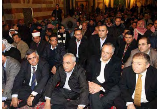
סלאם פיאצ' משתתף בתפילת יום שישי במסגד במערת המכפלה בחברון (סוכנות ופא, 26 בפברואר)

● ב-1 במרץ ערכה ממשלת סלאם פיאצ' את ישיבתה השבועית בחברון. הממשלה גינתה את ההחלטה הישראלית והזהירה כי ההסלמה שנוקטת ישראל עלולה להוביל לאלימות ולערער את יציבות הרשות הפלסטינית.