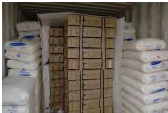
Kisten mit 107mm Raketen.