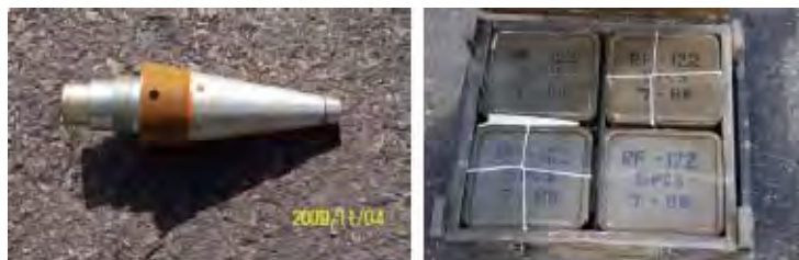
Geschosse für 122mm Raketen. Links: Ein Geschoss. Rechts: Geschoss Pakete.

iii) Etwa 700 Geschosse für 122mm Raketen. Die Geschosse sind neu.