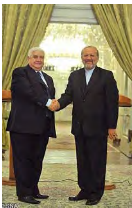
Der iranische und syrische Aussenminister bei einem Treffen in Tehran (ISNA, 4. November 2009).