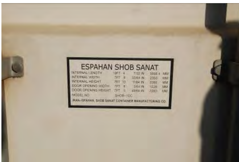
Die Aufschrift auf einigen Containern gab den Standort der Transportgesellschaft ausdrücklich als Ispahan, Iran an.

3. Die Frachtliste des Schiffes gab den Inhalt der Container fälschlicherweise als 24,224 Polyethylen Säcke aus. In Wahrheit wiesen die zahlreichen Aufschriften auf den Containern, die Frachtliste des Frachters, andere Dokumente und die Polyethylen Säcke in den Containern, die dazu dienten die Waffen zu tarnen, ganz klar darauf hin, dass die Waffen aus dem Iran stammen . Sie lassen erkennen, dass die Iraner, getragen von einem möglicherweise übertriebenen Selbstvertrauen, es nicht einmal für notwendig hielten, die Herkunft der Waffen zu verheimlichen. Auf den Waffen selbst war kein Hinweis darüber vorhanden, dass sie im Iran hergestellt worden waren.