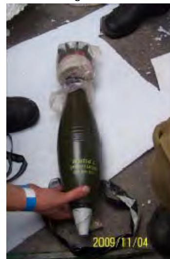
Links: Eine Kiste mit 120mm Mörsergranaten mit englischer Aufschrift. Rechts: Eine Granate.