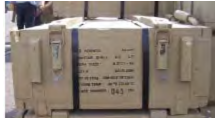
Links: Kisten von 60mm Mörsergranaten wurden auf dem Schiff entdeckt. Rechts: Eine Granate.

v) Etwa 2,300 81mm Mörsergranaten mit einer Reichweite von 4.7 km, ( 2.92 Meilen). Es handelte sich um neue Granaten aus iranischer Herstellung.