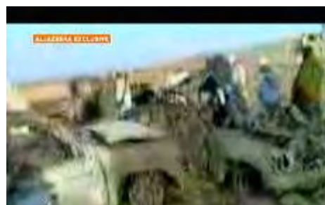
Fotos, die laut Al-Jazeera TV, am Angriffsort im Sudan aufgenommen wurden.