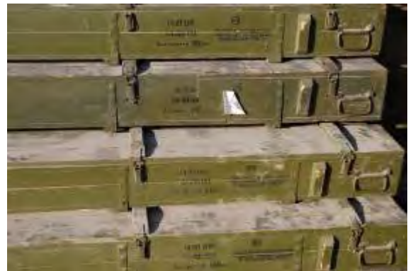
Rechts: Einige der auf dem Schiff beschlagnahmten Kisten. Links: Kisten mit 122mm Raketen.

10. In der Waffenladung befanden sich u. a.: