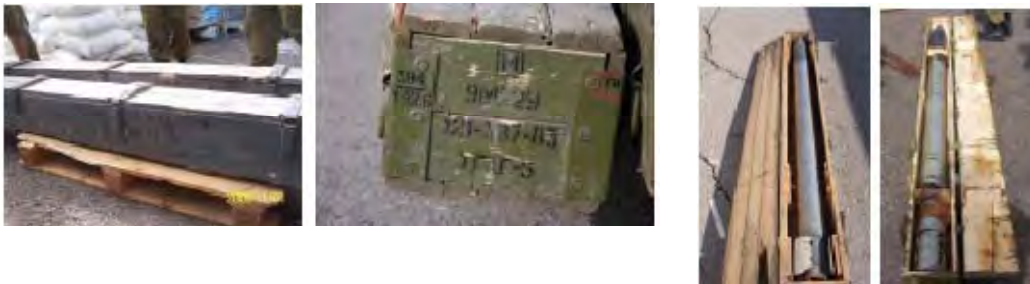
Die zwei Fotos links: Diese 122mm Raketen befanden sich in den Kisten auf dem Schiff. Die zwei Fotos rechts: Ähnliche Raketen wurden während des Zweiten Libanon Krieges im Libanon entdeckt.

ii) Etwa 700 122mm Raketen mit einer Reichweite von 20 km, ( 12.42 Meilen). Die auf dem Frachter beschlagnahmten Raketen wurden 1988 hergestellt. Ihr Haltbarkeitsdatum war schon überschritten, was ihre Treffsicherheit herabsetzt und die Wahrscheinlichkeit von technischen Schwierigkeiten beim Abfeuern ansteigen lässt. Sie waren in Kisten mit der Aufschrift " Ersatzteile für Planierdrauen. "