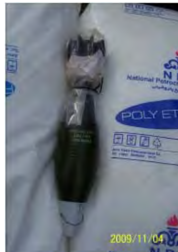
Links: Kisten mit 81mm Mörsergranaten. Rechts: Eine Granate.

vi) Etwa 780 120mm Mörsergranaten mit einer Reichweite von 6.5 km ( 4.03 Meilen). Es handelte sich um neue Granaten aus iranischer Herstellung.