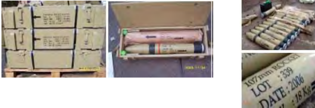
Die zwei Fotos links: Auf dem Schiff beschlagnahmte 107mm Raketen. Die zwei Fotos rechts: Ähnliche, 2009 im Irak entdeckte Raketen. Beide wurden vom Iran exportiert.

ii) Etwa 700 122mm Raketen mit einer Reichweite von 20 km, ( 12.42 Meilen). Die auf dem Frachter beschlagnahmten Raketen wurden 1988 hergestellt. Ihr Haltbarkeitsdatum war schon überschritten, was ihre Treffsicherheit herabsetzt und die Wahrscheinlichkeit von technischen Schwierigkeiten beim Abfeuern ansteigen lässt. Sie waren in Kisten mit der Aufschrift " Ersatzteile für Planierdrauen. "