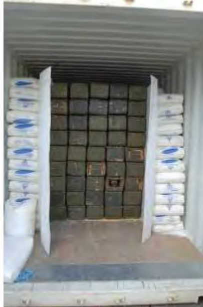
Kisten mit 122mm Raketen.