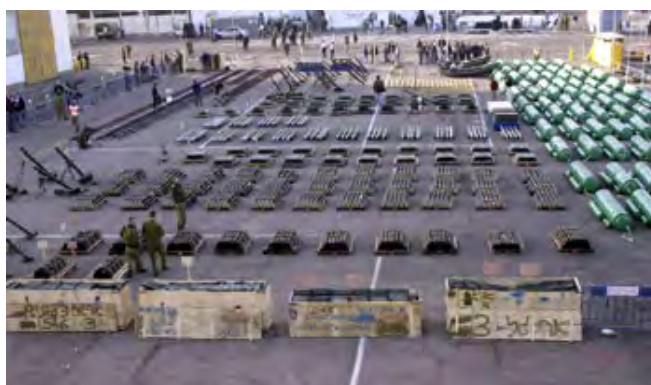
Die auf der Karin-A beschlagnahmten Waffen (IDF Sprecher).

i) Im Dezember 2001 wurde die Karin-A im Iran mit Waffen für den Gazastreifen beladen. Der Frachter fuhr Richtung Ägypten, in der Absicht, die Fracht dort zu löschen. Kleine Fischerboote sollten die Waffen übernehmen und sie in den Gazastreifen transportieren. Der Frachter transportierte eine grosse Waffenladung, die die Angriffsfähigkeiten der Terror Organisationen um ein Vielfaches aufgestockt hätten . Der Frachter wurde am 3. Januar 2002 von der israelischen Marine gekapert.