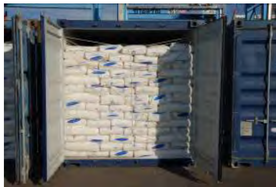
Säcke mit Polyethylen Pellets, die mit weissen Plastikseilen gesichert sind. Die Waffen befanden sich in Kästen hinter diesen Säcken.

iner der zur Tarnung verwandten Polyethylene Säcke. Der englischen und persischen Aufschrift nach zu urteilen, wurde es von der iranischen nationalen petrochemischen Gesellschaft hergestellt, deren Telefonnummer als 9821 angegeben wird, [98 ist die internationale Vorwahlnummer des Irans ] +8788987.