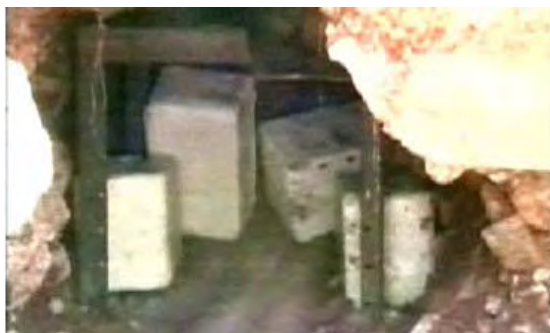
Eine Grube mit Sprengsätzen, freigelegt im Verlauf des zweiten Libanonkrieges im östlichen Teil des Südlibanon

3. Das Ausheben von Gruben und ihr Anfüllen mit Sprengstoff durch die Hisbollah als Teil ihres kämpferischen Konzepts ist bereits aus dem zweiten Libanonkrieg bekannt. Zu diesem Zweck grub die Hisbollah eine Anzahl von Erdlöchern im Süden des Libanon und füllte jedes mit Hunderten von Kilogrammen an Sprengstoff . Die Gruben lagen unterhalb der Erdoberfläche an der Seite der hauptsächlichlichen Zufahrtstraßen in den Libanon sowie an zentralen Straßenkreuzungen verborgen. Ein im Verlauf des zweiten Libanonkrieges in dem Dorf Kafr Killa beschlagnahmtes Dokument beschrieb das System der Sprengstoffgruben am Rande von Straßen in Einzelheiten, einschließlich an der der Kreuzung von Sarda-Al-Khiyam-Burj al-Mlouk, wo UNIFIL vor kurzen Sprengsätze entdeckte. 1