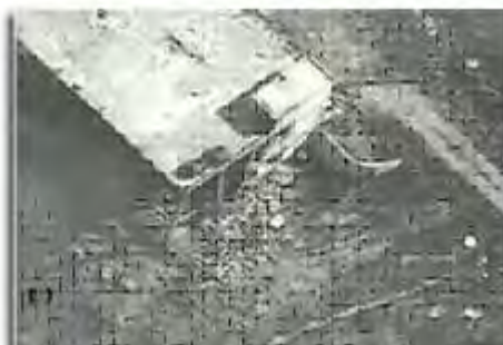
Luftaufnahme nach der Explosion des Gebäudes in Khirbet Silim.

A) Am 14. Juli 2009 erfolgte eine Explosion in einem verlassenen Gebäude am Rande des Dorfes Khirbet Silim nördlich des Berges Bint Jbeil in einer Entfernung von etwa 15 Kilometern oder 9,3 Meilen von der israelischen Grenze. Das Gebäude diente der Hisbollah als Lagerstätte für Waffen und beherbergte Raketen, Munition für Maschinengewehre sowie Mörser und Artilleriegranaten. 2