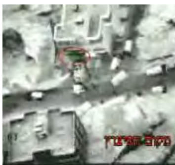
Das Waffenbersteck in Tair Filsay, das am 12. Oktober 2009 in die Luft flog

B) Am 12. Oktober 2009 erfolgte eine Explosion in dem Haus von Sayid Issa, einem Aktivisten der Hisbollah, in dem Dorf Tair Filsay , rund 15 Kilometer im Nordosten der Stadt Sidon und südlich des Litanni-Flusses gelegen. Im Verlauf der Explosion des Gebäudes, das als Waffenlager diente, wurden anscheinend mehrere Personen verletzt. 3