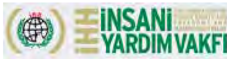
IHH logo: Rechts unten auf dem Globus ist die Friedenstaube zu sehen.

3. Parallel zu ihrer legitimen humanitären Tätigkeit unterstützt die IHH jedoch radikal islamistische Terror-Netzwerke. In den letzten Jahren gewährt sie der Hamas ihre offene Unterstützung (über die Union of Good). Darüberhinaus verfügt das Informationszentrum für Nachrichtendienst und Terror über zuverlässige Angagen darüber, dass die IHH in der Vergangenheit globalen Dschihad Netzwerken logistische und finanzielle Unterstützung gewährt hat.