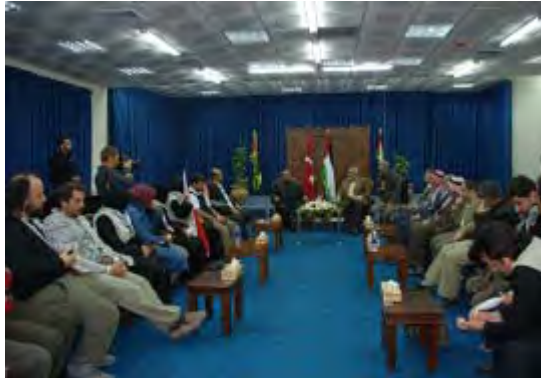
Bülent Yildirim tagt im Gazastreifen mit Ismail Haniya und anderen hochrangigen Hamas-Vertretern ( 7. Januar 2010). 2

8. Im Januar besuchte Bülent Yildirim den Gazastreifen und tagte dort mit Ismail Haniya, dem Führer der de facto Hamas Regierung.