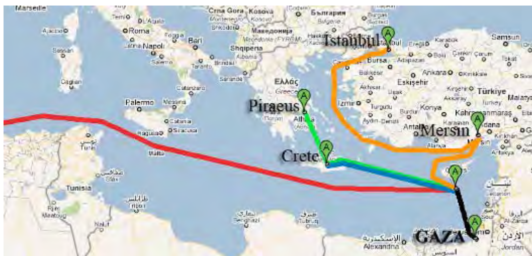
Die Schiffsroute der Flotille in den Gazastreifen. Die rote Linie zeigt die Route der Rachel Corrie, die von Irland aus in See sticht. 7