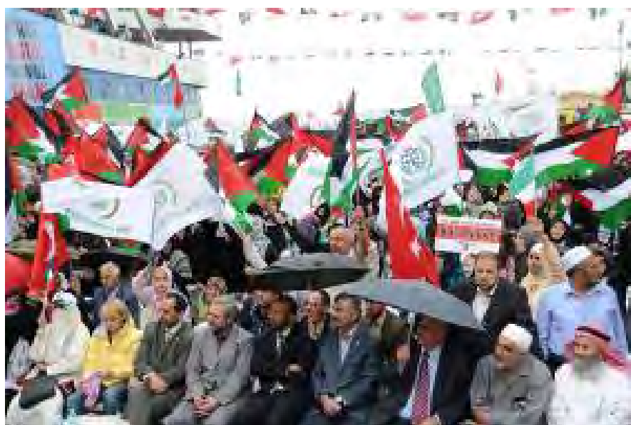
Die Kundgebung in der Türkei war Teil der Vorbereitungen zur Abfahrt des Schiffes. Die Teilnehmer halten türkische, palästinensische und Hamasfahnen und Fahnen von Hamas-angeschlossenen und radikal-islamistischen Organisationen (die Shahadah steht auf der grünen Fahne) (IHH Webseite, 23. Mai 2010).