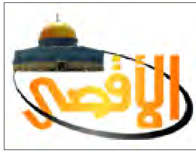
Das Al-Aqsa TV Logo

6. Al-Aqsa TV ist eines der wichtigsten Medien der Hamas und wird von der Hamas im Gazastreifen als wichtiges Werkzeug im Kampf der Hamas um die Herzen und Gemüter finanziert und betrieben. Al-Aqsa TV wurde im Anschluss an die Wahlen gegründet, die die Hamas im Januar 2006 gewonnen hatte. Die Hamas Führung stellte die anfängliche Finanzierung, etwa eine halbe Million Dollar - und ihre Aktivisten verwalteten den Sender. Nach Angaben des amerikanischen Finanzministeriums überwies das Hamas Hauptquartier in Damaskus dem Sender Ende 2009 Hunderttausende von Dollar und Hamas Führer leiten auch weiterhin seine Tätigkeiten. Aus Gründen, die im weiteren Verlauf freigegeben wurden, berichtete das Finanzministerium, Al-Aqsa TV strahle oft Kindersendungen aus, die Aufwiegelung und Propaganda enthalten, Programme, die darauf abzielen, Kinder als zukünftige bewaffnete Terroristen und Selbstmordattentäter zu rekrutieren.