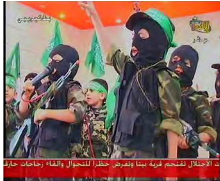
Eine Abschlussfeier im Kindergarten (Al-Aqsa TV, 31. Mai 2007).

B. In den letzten 14 Tagen von Mai 2007 wurde im Al-Aqsa TV Programm "Pioniere von morgen" die Mickey Maus Figur Farfour vorgestellt. Diese Mickey Maus diente dazu, den Kindern den Hass gegen Israel beizubringen und sie mit der Hamas Ideologie zu indoktrinieren; u. a. gehören dazu die islamische Machtübernahme in der ganzen Welt, die Fortsetzung der Gewalt und des Terrors gegen Israel (der sogenannte "Widerstand"), die Zerstörung des Staates Israel, die "Befreiung" der Al-Aqsa Moschee und die "Befreiung" des Irak und anderer "von Mördern besetzten" muslimischer Staaten. Nach der in der westlichen Welt geäußerten Kritik an der Verwendung von Mickey Maus um Kinder aufzuhetzen, wurde Farfour aus dem Programm entfernt – es hieß, Farfour sei "von den Israelis getötet worden."