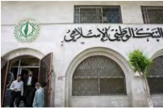
Die Fassade der Islamic National Bank in Gaza City ( Al-Ayam , 22. April 2009).