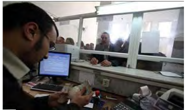
Der Innenraum der Islamic National Bank in Gaza City ( Ma'an News Agency , 18. März 2010).

12. Im Mai 2009 überwies das Finanzministerium der de facto Hamas Regierung €1,1 Millionen auf die Bank, um die Gehälter der Izz al-Din al-Qassam Brigaden zu zahlen. Die Hamas eröffnete für ihre Mitglieder Tausende von Bankkonten, auf die die Gehälter überwiesen werden (laut Ankündigung des US Finanzministeriums vom 18. März 2010).