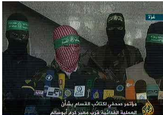
Auf einer Pressekonferenz übernimmt Abu Obeida im Namen der Hamas die Verantwortung für den Anschlag (Al-Jazeera, 19. April)

6. Die Hamas übernahm die Verantwortung für diesen Anschlag. Auf einer von Abu Obeida abgehaltenen Pressekonferenz, dem Sprecher der Izzedine al-Qassam-Brigaden, sagte er, dass die Hamas die Operation namens „ Explosions-Warnung “ als Protest gegen die schwierige Lage im Gazastreifen ausgeführt habe (Ma'an Nachrichtenagentur, 19. April).