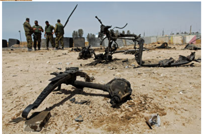
Das sind die Überreste eines Autos mit Autobombe am Grenzübergang Kerem Shalom (Foto: IDF-Sprecher, 19. April)