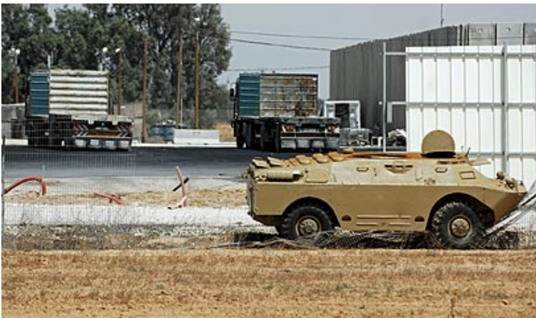
Ein BRDM Radschützenpanzer, der von Mahmud Abbas Sicherheitskräften konfisziert und beim Anschlag auf den Grenzübergang Kerem Shalom eingesetzt wurde

Am Pessach-Abend konnten die IDF-Einheiten einen kombinierten Anschlag am Grenzübergang Kerem Shalom vereiteln. Dieser Anschlag wurde auf Kosten der Einwohner des Gazastreifens von der Hamas als Teil ihres Kampfes gegen die Grenzübergänge verübt.