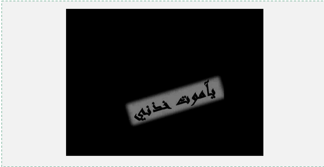
הפוסט, שהעלה אמג'ד סכרי, ב-24 ביולי 2015: "הוי מוות, קח אותי"