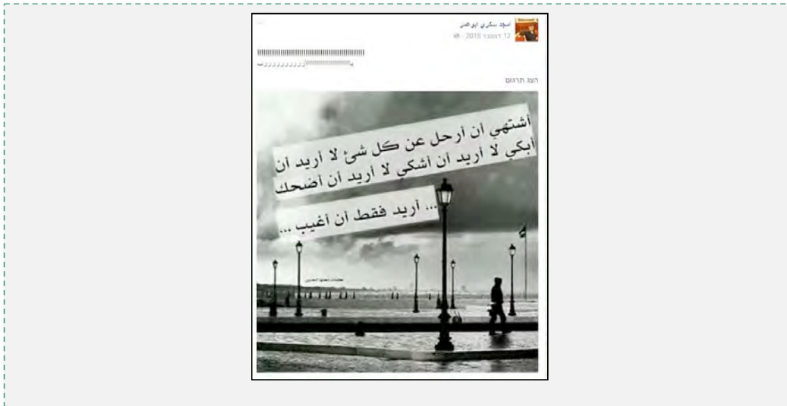
הפוסט שהעלה אמג'ד סכרי ב-12 בדצמבר 2015.

ה. ב-2 בדצמבר 2015 העלה אמג'ד סכרי בה נראה לב שבור. מתחת לכרזה כתב: "מצב ליבי: מת".